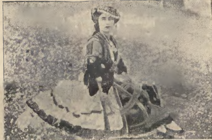
Zamożna Greczynka w tradycyjnym narodowym stroju.

UMEBLOWANY niekropujący, miły pokój... 26984