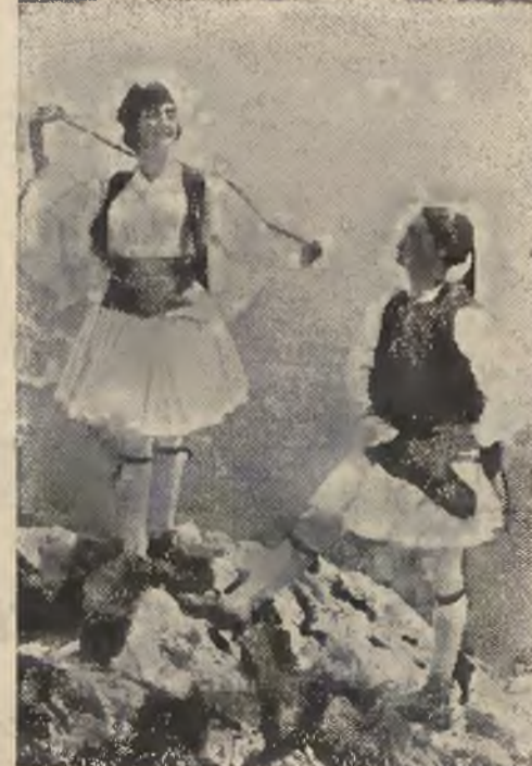
Stroje ludowe w Grecji, które utrzymały się dotychczas, odznaczają się niezwykłą barwnością i oryginalnością