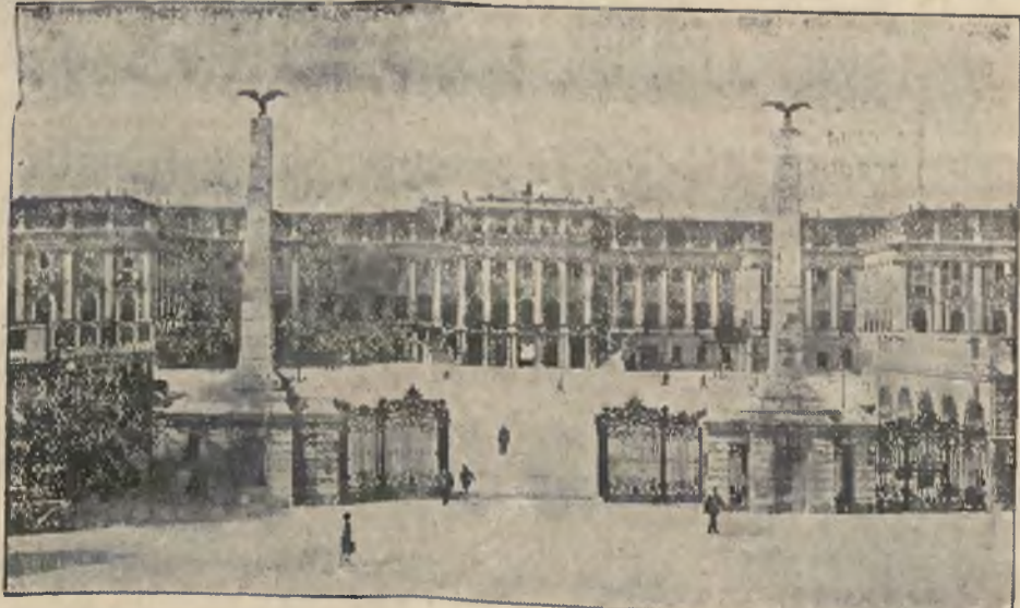
Słynny pałac cesarski w Schoenbrunn pod Wiedniem, w którym obecnie mieści się szkoła dramatyczna.

CIEPŁE i wygodne pantofle i papucze zimowe poleca i wykonuje „Ibis” Lwów, ul. Halicka 5 I p. 710