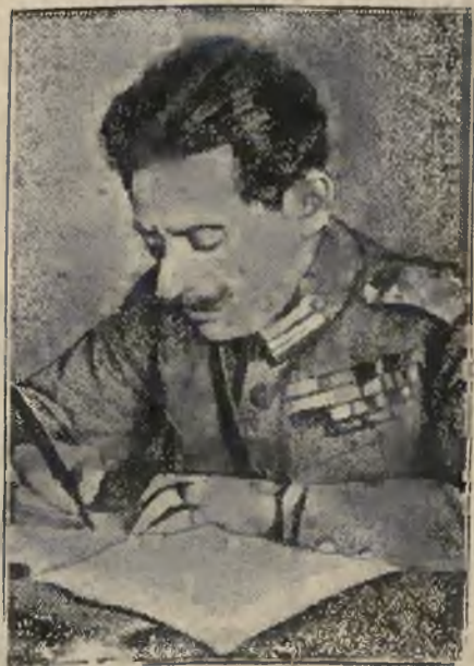
General Kondylis, szef nowego rządu greckiego