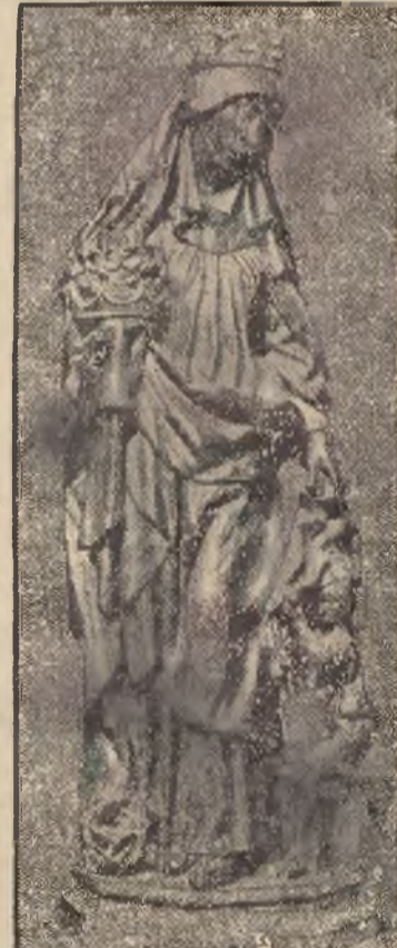
Wspaniały gofycycki grobowiec św. Elżbiety, w Katedrze w Marburgu. Obok drewniane posąg świętej znajdujący się w Muzeum Berlińskim.