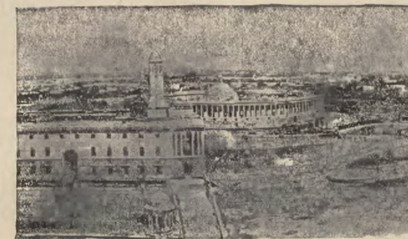
Nowa stolica Indji, zwana New Delhi, wybudowana w ciągu lat 19-tu.

Fortepiany krótkie, najnowsze modele, wielki wybór tanio sprzedaje HANAK, Lwów, Piłsudskiego 21, I p. 1111