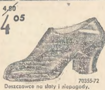
70355-72 Deszczowce na słoty i niepogody.