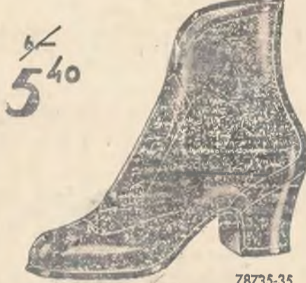
78735-35 Przed przeziębieniem chronią nasze śniegowce.