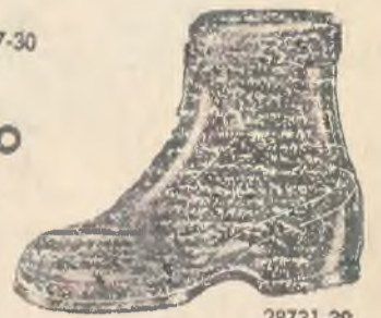
28731-39 Gumowy śniegowiec dla dzieci. Chroni przed przeziębieniem. P-49 'J