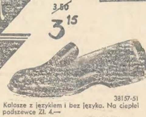
38157-51 Kaloše z językiem i bez języka. Na ciepłej podszewce Zł. 4.—