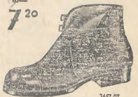
3657-07 Ciepłe meltonki na gumowych spodoch. Wierzch z ciepłego filcu.

POLSKA SPÓŁKA OBUWIA Bata FABRYKA W CHEŁMKU. (woj. krakowski.)