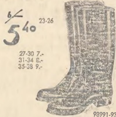
27-30 7.- 31-34 8.- 35-38 9.- 98991-93 „GENERAŁKI” - całogumowe wysokie buty. Dla dzieci w niepogody.