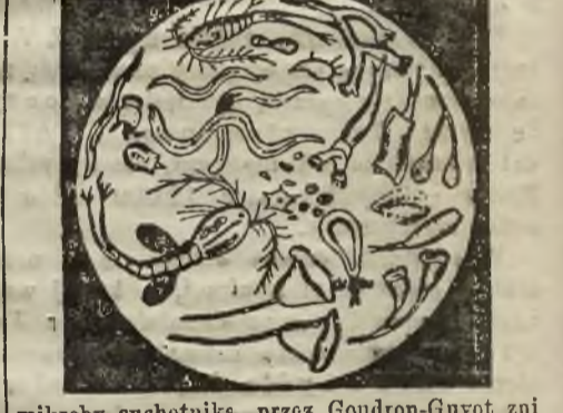
mikroby suchotnika, przez Goudron-Guyot zniszczone.

Kropka wody badana przez mikroskop. Kropki cieczy, która wydosłano z płuc suchotnika w trzecim dniu po jego śmierci, zawierały mikroby, które tu widimy przedstawione. „Goudron-Guyot” zabija te mikroby, nie tylko w wodzie, lecz i w przecach.