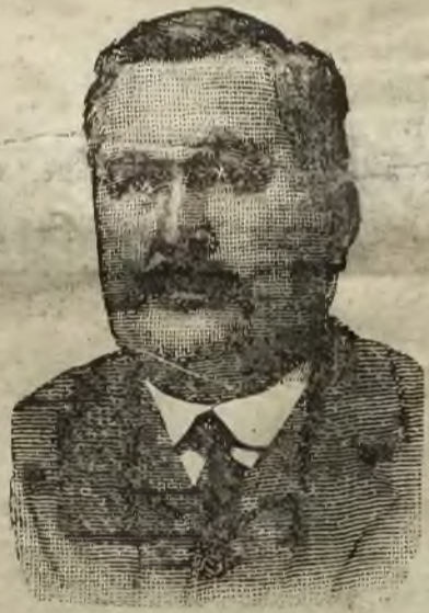
Ciechanów, 11 marca 1911. Sanowny Panie Trayser!

Z przyjemnością przesyłam WPanu fotografię swoją i jestem obowiązany potwierdzić, że środek „Trayser” jest najskuteczniejszy i najlepszy dotychczas wynaleziony do leczenia reumatyzmu i podagry, gdyż po użyciu tylko małej ilości tego cudownego środka czuję się zupełnie zdrowo i rekomenduję takowy wszystkim znajomym.