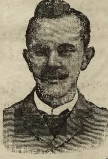
Łublin, 26 lutego 1911 r. Sanowny Panie!

Przepraszam najmocniej, że tak długo nie dałem żadnej odpowiedzi, gdyż czekałem rezultatu mego leczenia się, i dzięki Pańskiemu wynalazkowi „Trayser” jest mi zupełnie lepiej. Wdzięczność moja dla WPana jest wielką i gdziekolwiek mogę, staram się rekomendować ten środek.