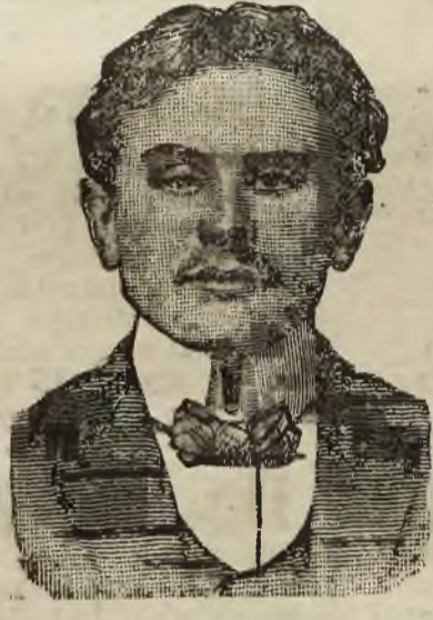
Łódź, 12 lutego 1911 r. Sanowny Panie Trayser!

Zwracam się do WPana i donoszę Mu, że preparat „Trayser” otrzymałem i po użyciu takowego czuję się znacznie lepiej, spodziewam się, iż przy dalszym używaniu pastylek „Trayser” wyleczę się całkowicie, gdyż czuję się coraz lepiej. Niniejszym załączam swoją fotografię, jak również upraszam list mój umieścić w spisie wyleczonych preparatem „Trayser”. Uważam to za swój obowiązek, by preparat „Trayser” polecać między cierpiącymi. Dziękuję WPanu za takową pomoc.