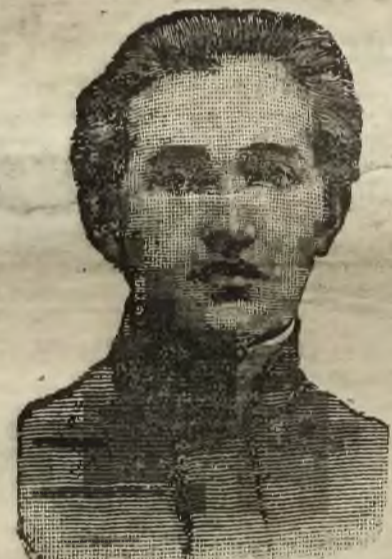
Łódź, 6 lutego 1911 r. Sanowny Panie Trayser!

Niniejszym zaświadczam skuteczność Pańskiego preparatu „Trayser”. Po użyciu jednego pudełka „Trayser” styk przeciw reumatyzmowi i podagrę czuję się zupełnie dobrze, za co WPanu składam najserdeczniejsze podziękowanie. Pański preparat rekomenduję znajomym. Niniejszym zasylam swoją fotografię i proszę WPana list mój zamieścić w spisie wyleczonych.