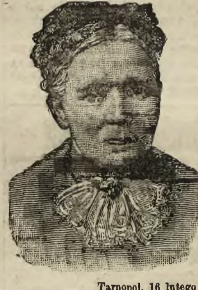
Tarnopol, 16 lutego 1911. Sanowny Panie!

Po użyciu Pańskiego leczniczego środka „Trayser” czuję się o wiele lepiej i już mogę sama chodzić. Ten pan z ulicy Kraszewskiej napisał z mojej rekomendacji. Posyłam WPanu fotografię oraz składam serdeczne dzięki za Jego skuteczny „Trayser”.