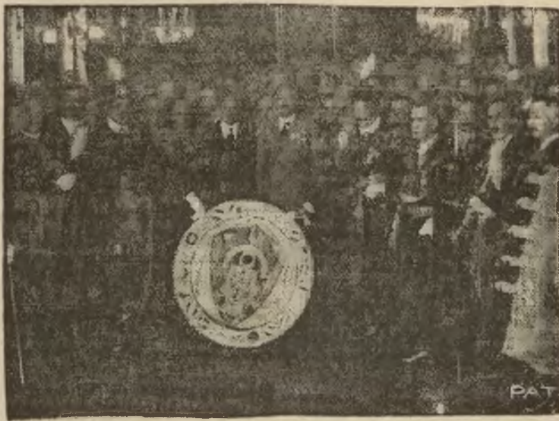
Ilustracja nasza przedstawia grupę gości uczestników zawodów, zebranych w sali strzelniczej lwowskiej. Na pierwszym planie tarcza honorowa, do której przedstawiciele wszystkich państw oddali strzały.