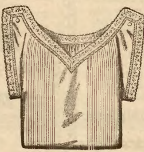
874 6 7

białe i kolorowe, z koronką i wstawką, od zlr. 4.25 wzwyż.