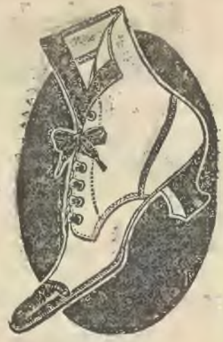
wszelkiego rodzaju i najlepszej jakości.

Ilustrowane cenniki wysyłamy na żądanie darmo i opłatnie.