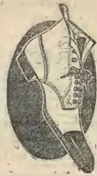
najlepsze obuwie teraźniejszości