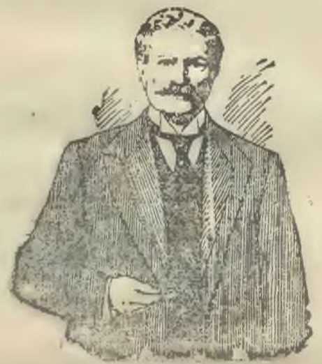
Wiele Szanowny Panie!

Jest to metoda zupełnie prosta. Nie używa się lekarstwa, maści, nacierania, aparatu, lub tak zwanej gimnastyki leczniczej, lecz jest to zupełnie prosta, naturze poddana rzecz. Lekarze i profesory wyrażali się o niej z pochwałą i stosują już tę metodę ku dobru ludzkości. Jestem tego zdania, że ta metoda ma wielkie znaczenie dla ludzkości. Proszę przeczytać jedno z licznych znaną, jakie nadchodzą co dzień do wynalazcy: