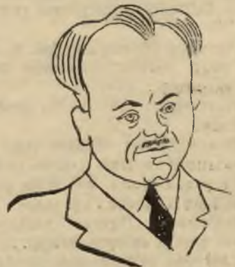
Minister M. Zydrnam Kościłkowski w karykaturze