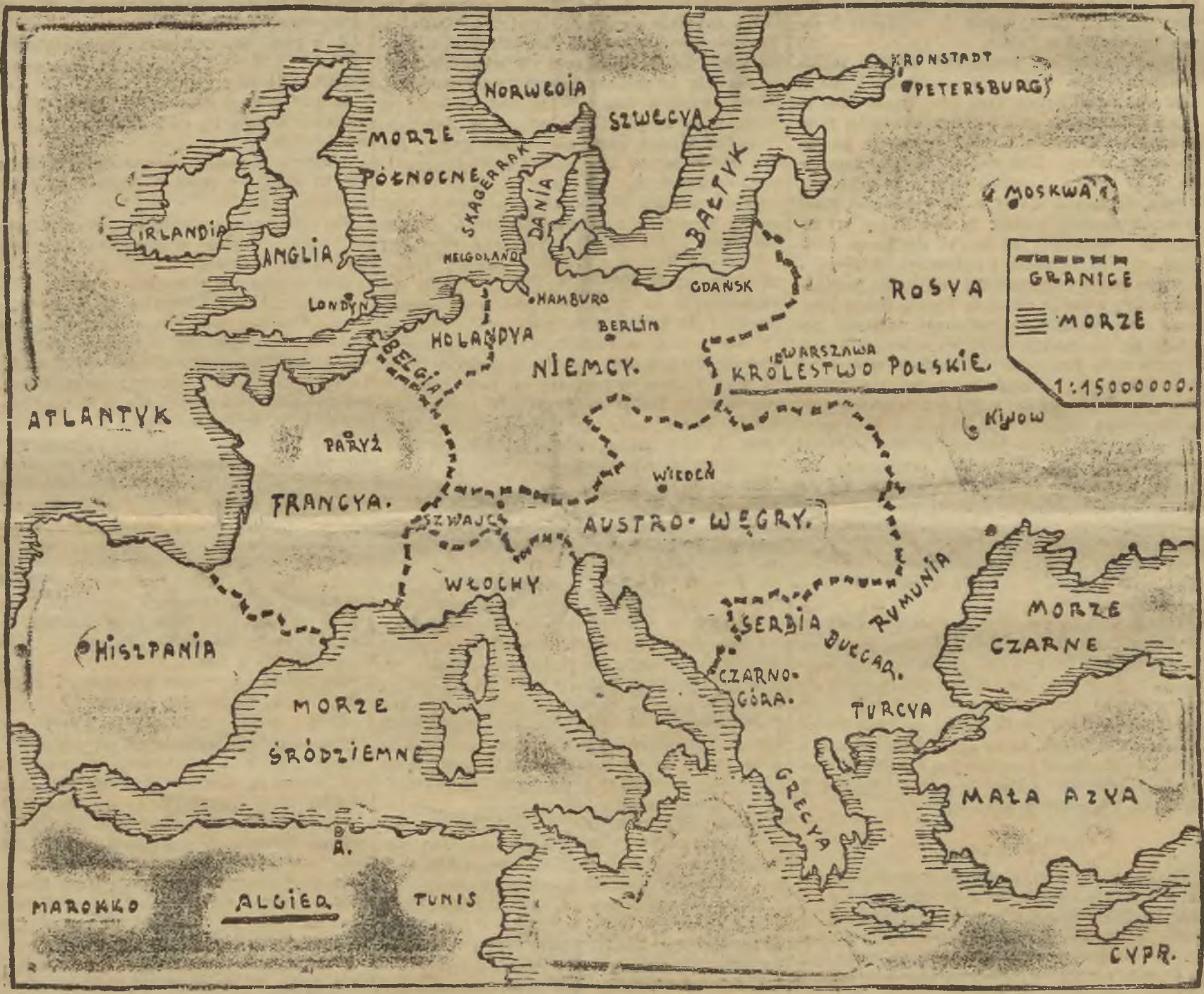
Teren wojny europejskiej.