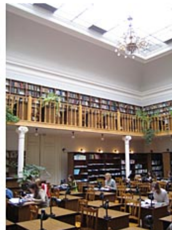
Left: Manuscript archives at the Stefanyk Library. Right: Scholars' reading room at the Stefanyk Library.

The Stefanyk Library is the second largest library in Ukraine, and arguably the most important with respect to Ukrainian history and identity. It was formally founded on January 2, 1940, several months after the establishment of Soviet rule in Western Ukraine. Its holdings were built from several major libraries in the region of L'viv, including many manuscripts confiscated from churches and monasteries by the Soviet authorities. The collections include 360 manuscripts in Old Slavonic from the 14th-16th centuries and 600 from the 17th-19th centuries. There are also manuscripts in the Ukrainian, Polish, Czech,