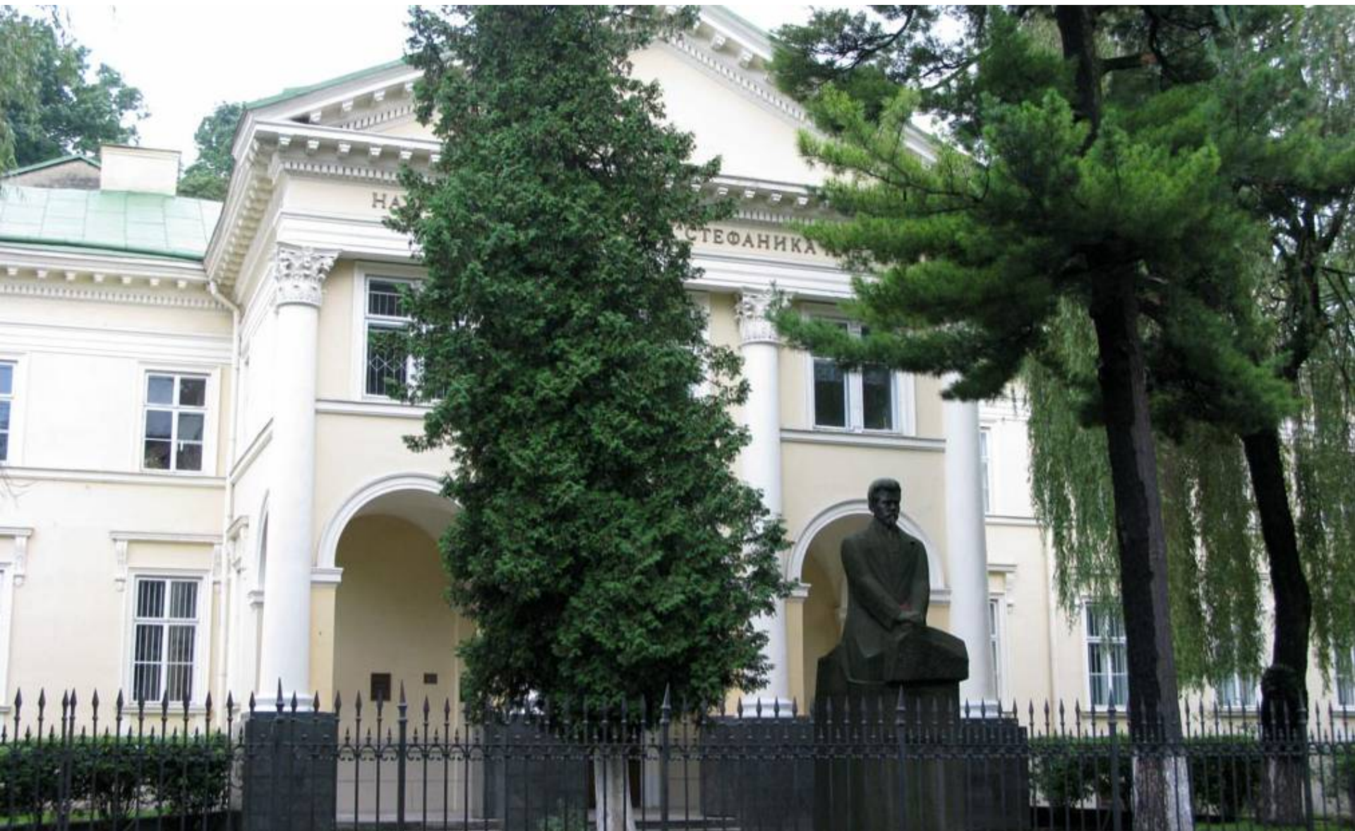
Lwowska Narodowa Naukowa Biblioteka Ukrainy im. W. Stefanyka