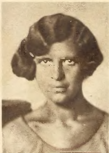
Monokel. Światło z przodu, boku i góry.