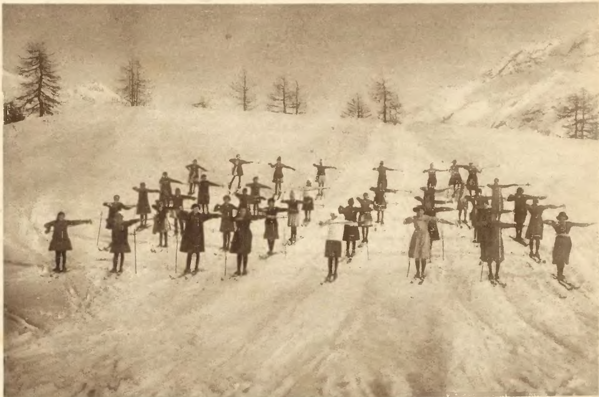
Sportowe ćwiczenia dziewcząt w szkołach szwajcarskich odbywają się w zimie również na wolnym powietrzu, a główną ich częścią jest jazda na ski.