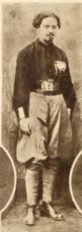
Gen. Balbo, naczelnik milicji faszystowskiej, ustąpił.