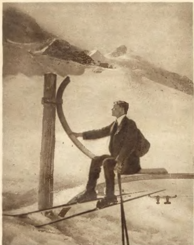
Odpoczynek wytrawnego jeźdźcy na ski podczas wielkiej wycieczki turystycznej po śnieżnych przełęczach Alp szwajcarskich.