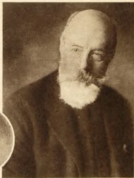
Dr. Michał Hainisch, wybrany ponownie prezydentem Rzpltej Austriackiej.