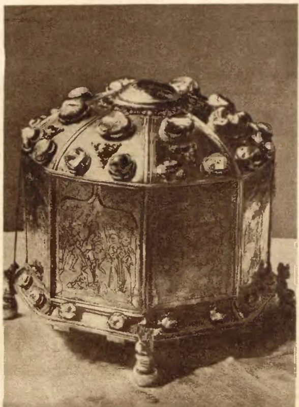
Bezcennej wartości złoty relikwiarz z głową św. Wojciecha, przechowywany do niedawna w skarbcu Katedry gnieźnieńskiej, zabrany przez świętokradzkich złoczyńców.