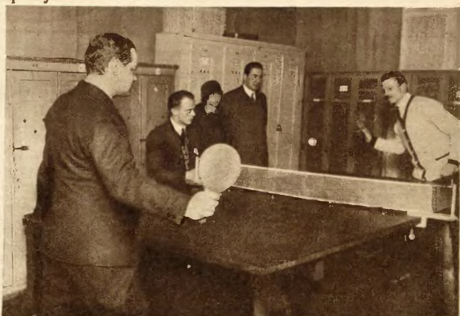
Zimowa pora uniemożliwia grę tenisową na wolnym powietrzu. Ale nie trzeba się na tych kilka miesięcy wyrzekać tego pięknego sportu — można go uprawiać w ciepłym ogrzonym pokoju. Nasze zdjęcia, przedstawiające partię panów i pań, same objaśniają urządzenie „placu” tenisowego w pokoju.