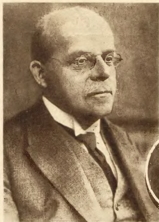
Kancelarz Marx skutkiem wyniku nowych wyborów do Sejmu Rzeszy podał się do dymisji.