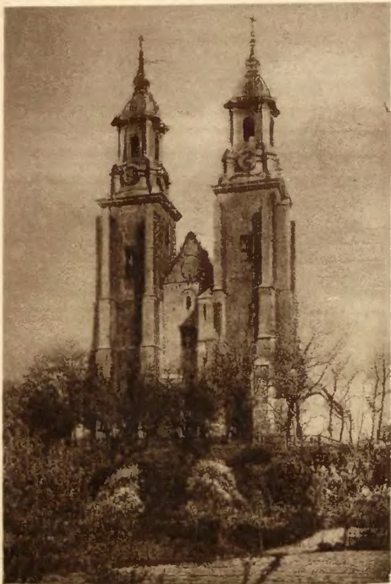
Starożytna Katedra gnieźnieńska, gdzie się, jako w siedzibie prymasa Polski, odbyła w r. 1024 koronacja Chrobrego. Jak wiadomo, istnieje obecnie plan przeniesienia siedziby prymasa z Poznania ponownie do Gniezna.

dzielnością swego oręża powiększył go i przed zakusami wschodnich i zachodnich wrogów obronił i zabezpieczył. Dzisiaj, w wskrzeszonej Polsce pamięć tego wiekopomnego dnia odnowiono. Dzwony katedry gnieźnieńskiej zadźwięczały ku czci wielkiego króla i wielkiej przeszłości, ale w ich głosie było i wezwanie do żywych. Historia się nie powtarza, więc inne dzisiaj i miecz polski zarówno jak i polityka polska ma przed sobą zadanie, niż za czasów Chrobrego, ale ostateczny cel pozostał dzisiaj ten sam, jaki był w roku 1024: potęga i bezpieczeństwo Polski.