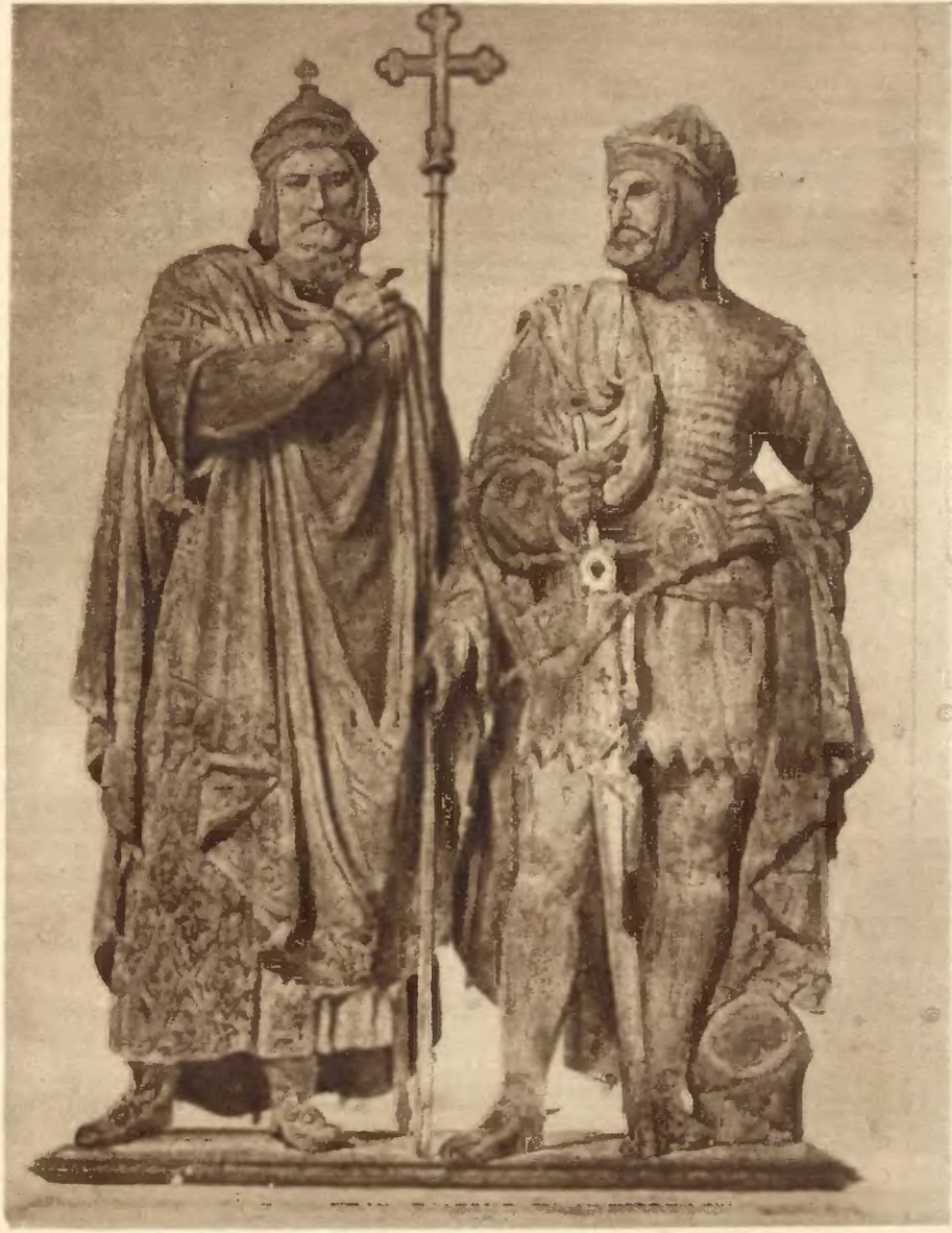
Nieznanego rzeźbkarza posąg Miecysława I. i jego syna Bolesława Chrobrego w „Kaplicy Złotej” Katedry poznańskiej, gdzie spoczywają prochy założyciela potęgi państwa polskiego.

W dawno minione czasy przenoszą uroczystości gnieźnieńskie, które się w tej starej siedzibie królów polskich w święto Bożego Narodzenia odbywały. Wspomniły się pierwsze początki Państwa Polskiego, gdy ono się z pomroków dziejowych wynurzało, już wtedy dwóch wrogów głównych mając przeciwko sobie, tych samych sąsiadów, którzy przez cały ciąg dziejów aż do dni najnowszych wrogami mu pozostali: sąsiada z obcego szczepu z Zachodu i tego od Wschodu, co chociaż krwią nam bliski, w duszy swej nigdy nie stał się nam krewnym. I przypomnieli się nam, ich praprawnukom, ci