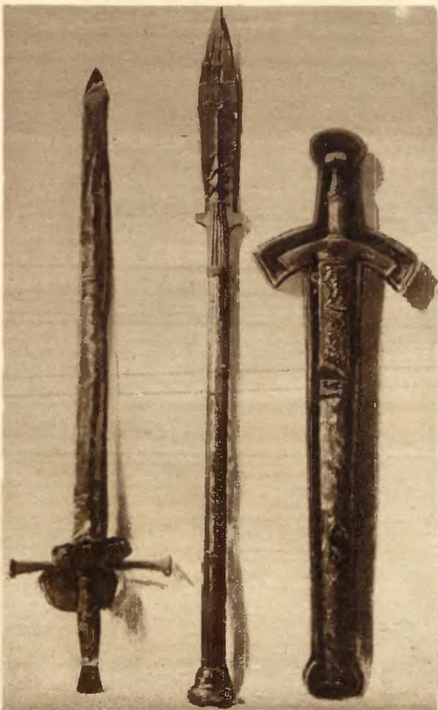
Drogocenne pamiątki czasów bolesławowskich: Szczerbiec, którym Chrobry uderzył w kijowską Złotą Bramę, włócznia św. Maurycego i miecz koronacyjny — przechowywane w skarbcu Katedry Królewskiej na Wawelu a reprodukowane tu według obrazów znakomitego malarza L. Wyczółkowskiego.