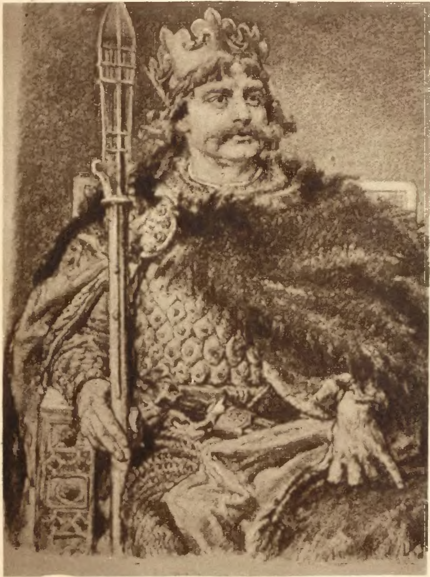
Reprodukcja przepysznego wizerunku Bolesława Chrobrego, drugiego z kolei „Pocztę Królów polskich” mistrza Jana Matejki. „Za takiego króla tylko dać się porąbać w kawałki”, pisze o tym rysunku znakomity historyk Śt. Smolka.