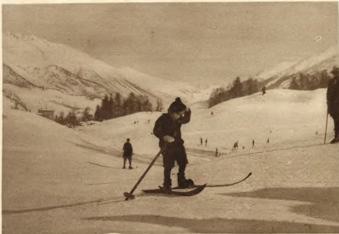
W St. Moritz, ognisku sportów zimowych w Szwajcarii, jest osobne miejsce przeznaczone wyłącznie dla początkujących, często bardzo jeszcze dzieciennych narciarzy. Jeden z tych małych jeźdźców, zmęczony trudnościami, drapie się w głowę, rozwiązując dylemat jazdy.