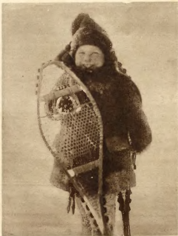
Na bezkresnych śnieżnych płaszczynach Kanady nosi się na nogach, pod właściwymi bucikami, szerokie śniegowce, chroniące swą płaszczyzną od zapadnięcia się w śniegu.