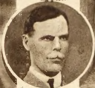
Kap. H. J. Huddleston, nowy sirdar (dowódca wojsk) angielski w Egipcie.