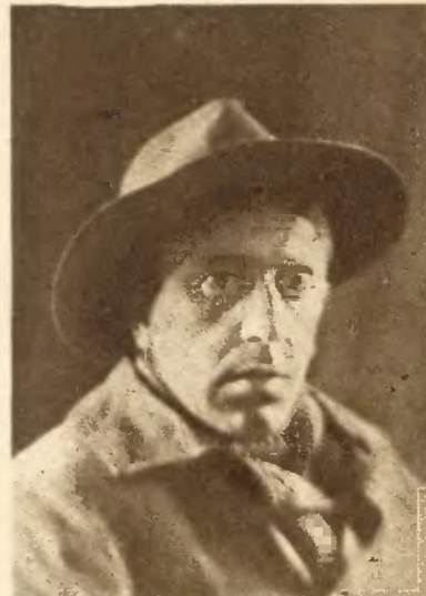
Monokel. Ostre światło z dwóch stron od przodu.