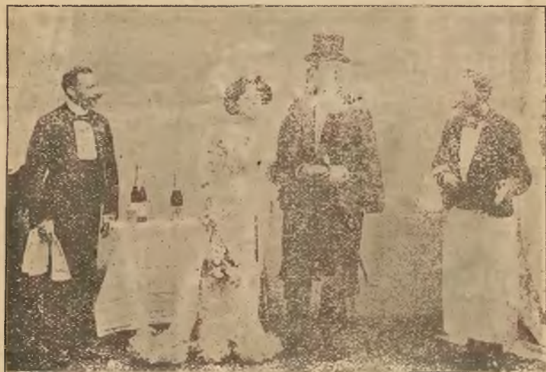
THE RAEMBLER COMPANY seena żonglerska w paryskiej restauracji.

LE BALLET VOLANT „Le Chasseur de Papillons“ Wielki balet napowietrzny z Wystawy paryskiej 1900 roku.