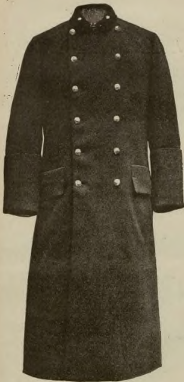
Wzór 13. (Widok z przodu.)