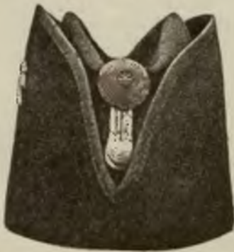
Wzór 21. (Widok z przodu.)