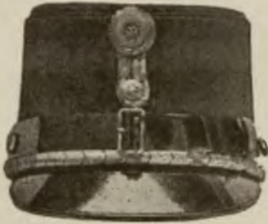
Wzór 19. (Widok z przodu.)