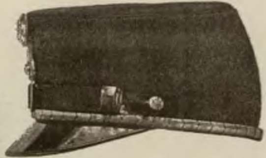
Wzór 20. (Widok z boku.)