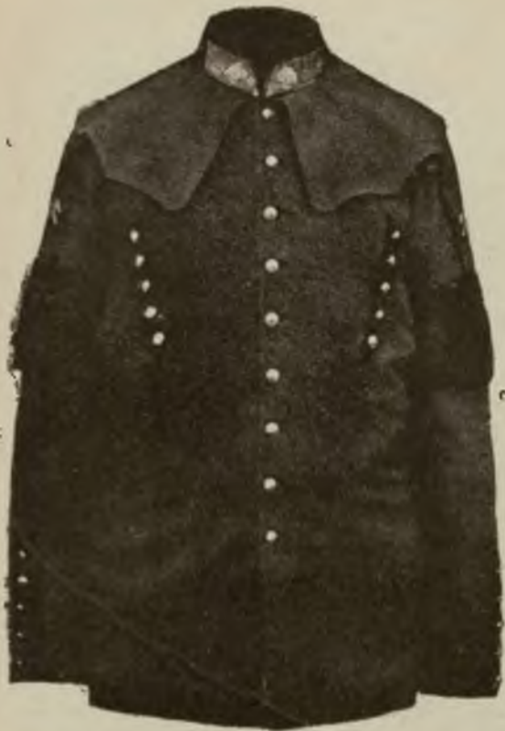
Wzór 16. (Widok z przodu.)