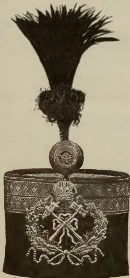
Wzór 10 a. (Widok z przodu.)