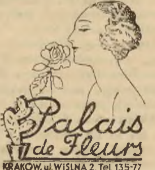
Palais de Fleurs KRAKÓW, ul. WISŁA 2. Tel. 135-77