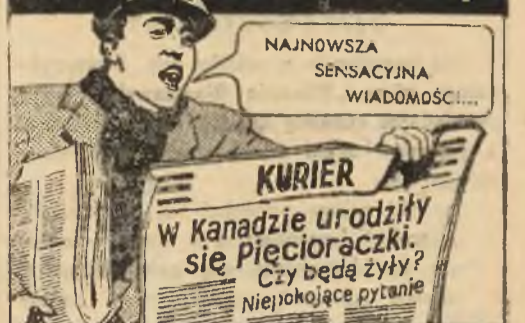
28 maja, 1934 r. Urodzenie Piecioraczków na dwa miesiące przed czasem poruszyło cały świat.