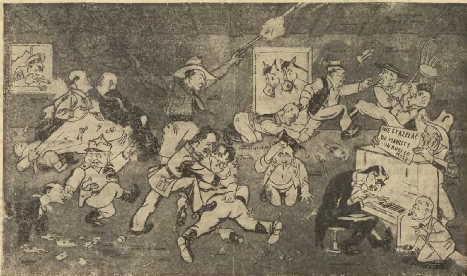
Zmierzch Zachodu („Marianne“).