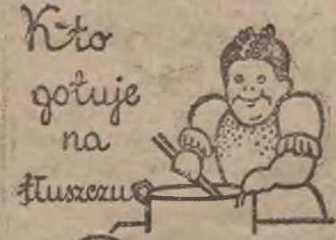
Kto gotuje na fluzerze Ceres oszczędza pieniądze.