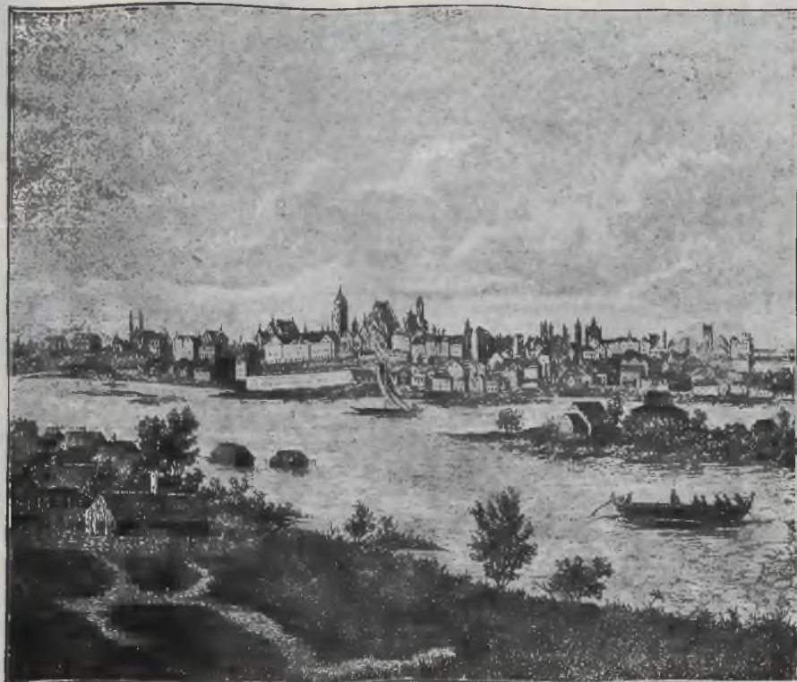
WARSZAWA w r. 1791.