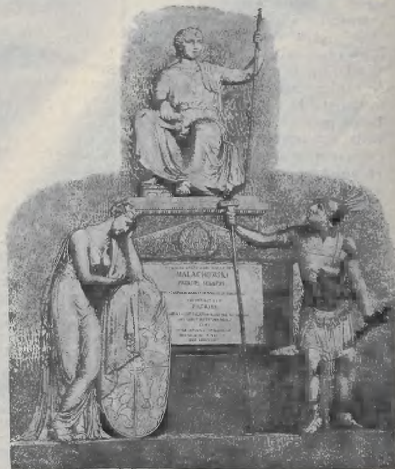
POMNIK ST. MAŁACHOWSKIEGO.