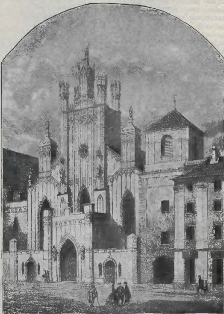
KOŚCIÓŁ ŚW. JANA W WARSZAWIE.