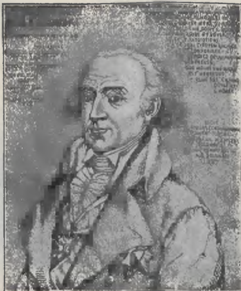
STANISŁAW MAŁACHOWSKI, Marszałek Sejmu czteroletniego.

REDAKCJA i ADMINISTRACJA: ulica Szewska Nr. 7, I. piętro.