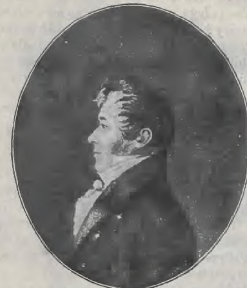
JULIAN URSYN NIEMCEWICZ.