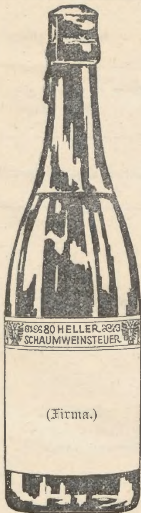
Wygląd z przodu.

(prawie \frac{1}{3} naturalnej wielkości).