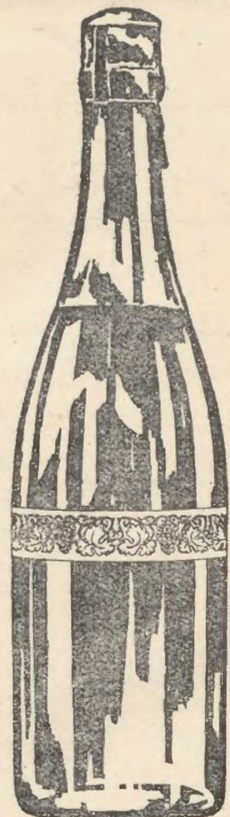
Wygląd z tyłu.

Znaczkę podatkową należy nakleić starannie na flaszce w sposób uwidoczniiony na rysunku; przytem przynajmniej połowa długości paska ma przylegać bezpośrednio do szkła.