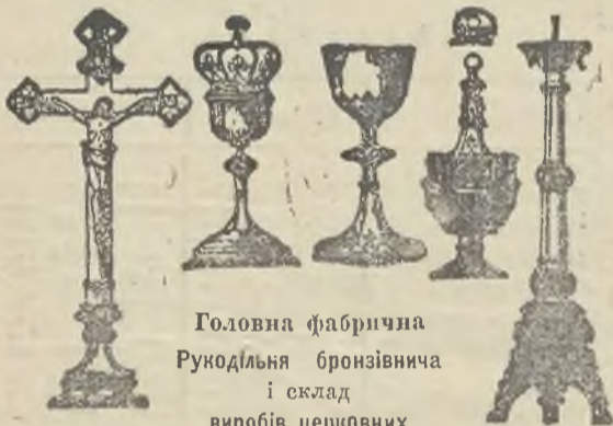
Головна фабрична Рукодільня бронзівничя і склад виробів церковних