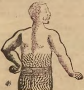
D. R. - G. - M. 86614.