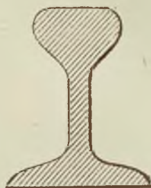
Profil szyny Vignola.

Profile szyn Vignola i siodełkowych N. 260 przedstawiają się następnie: