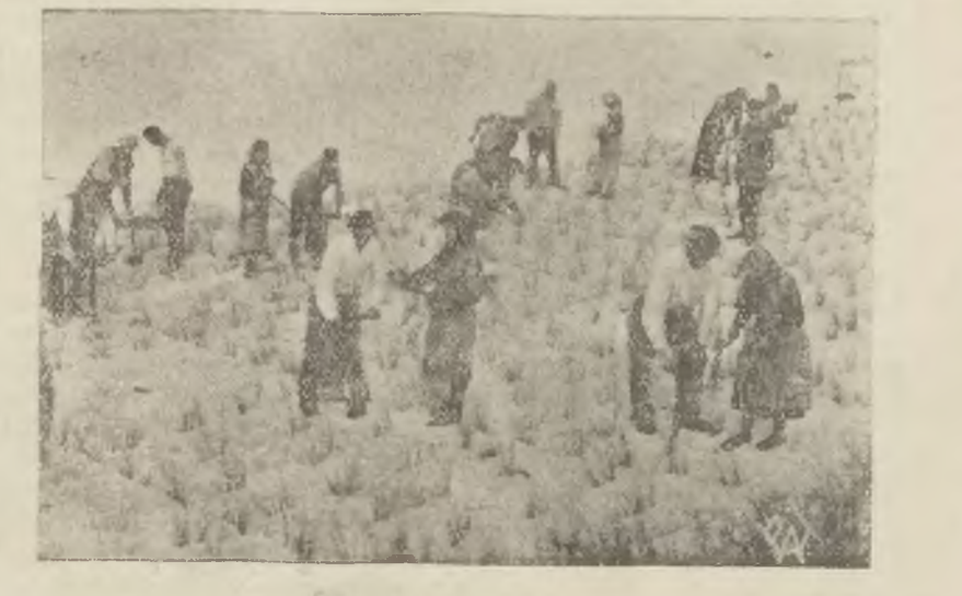
Na najbardziej zagrożonych odcinkach morza polskiego rozpoczął Urząd Morski prace nad zakładaniem plantacji traw, które przed rozwianiem utrzymują piaski wydym. Zdjęcie przedstawia pracę rybaków kaszubskich pod kierownictwem inż. p. Pejty na odcinku pod Kuźnięą na półwyspie Helskim.