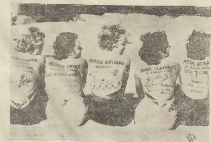
Na placach kąpielowych na Florydzie zastosowano nowy niezwykły pomysł reklamowy polegający na tym, że napisy reklamowe odbijano są na plecach, pływających pań...