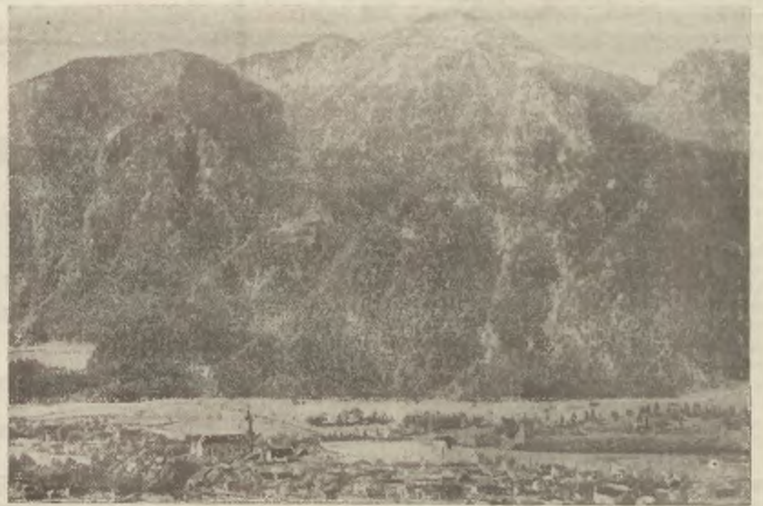
Wioska Oberamergau u stóp gór bawarskich. W poniedziałek rozpoczynają się w Oberamergau słynne widowiska pasywne, które w tym roku odbędą się poraz 300-setny. Cały świat interesuje się ogromnie tym jubileuszem, który ściga do Bawarii podróżnych z wszystkich części świata