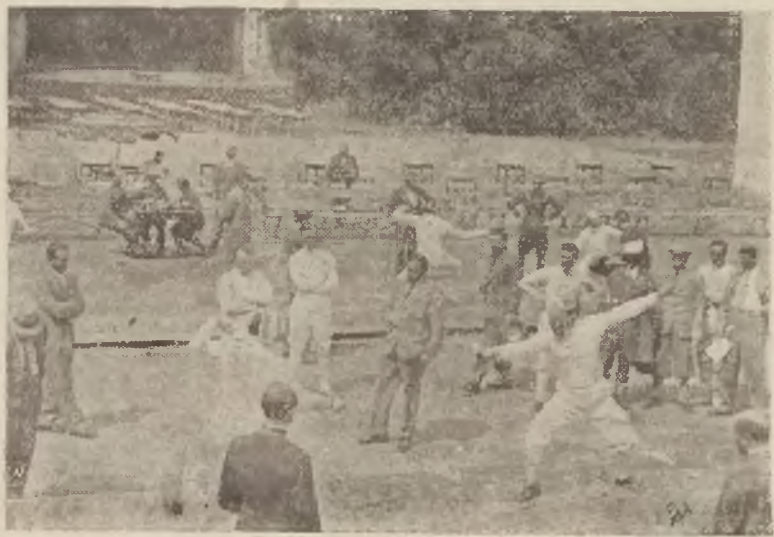
W Dolinie Szwajcarskiej w Warszawie rozpoczęły się w ub. środę szermierze mistrzostwa Europy przy udziale 120 zawodników z 12 państw. Zdjęcie nasze przedstawia jedno z pierwszych spotkań szermierza włoskiego z niemieckim.