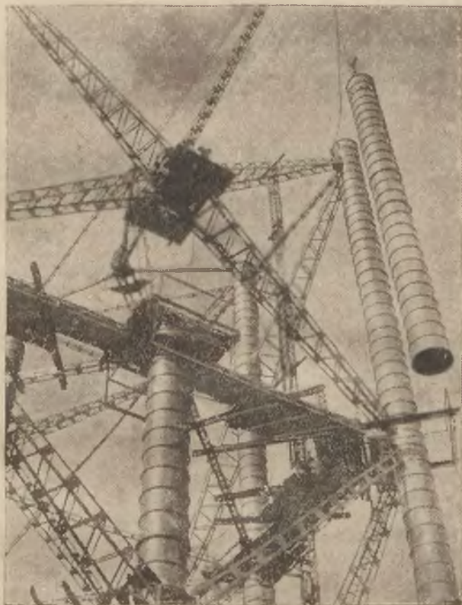
W Odense w Danii wybudowano wieżę wysoką na 175 m. Jako materiału budowlanego użyto rur żelaznych.