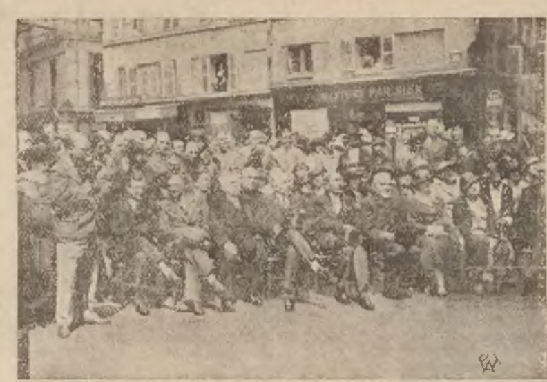
Z okazji uroczystości mickiewiczowskich w Paryżu została odsłonięta tablica pamiątkowa na ścianie domu przy rue de Seine 63, w którym mieszkał wieszcz polski.