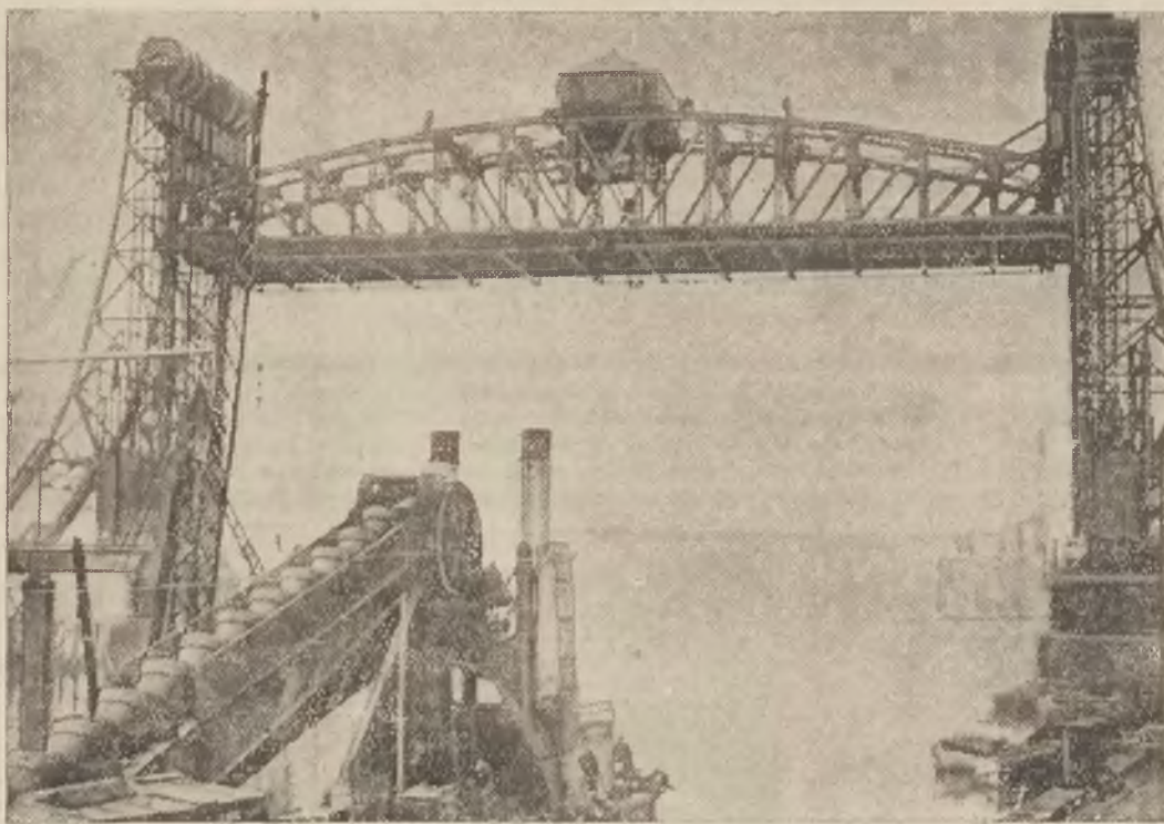
Pierwszy podnoszony most angielski. Długość jego wynosi 81 mtr.; szerokość 11,60 mtr. Wieże bożne wysoki są na 47,7 mtr. i pozwalają podnieść przęsło na wysokość 36 mtr.