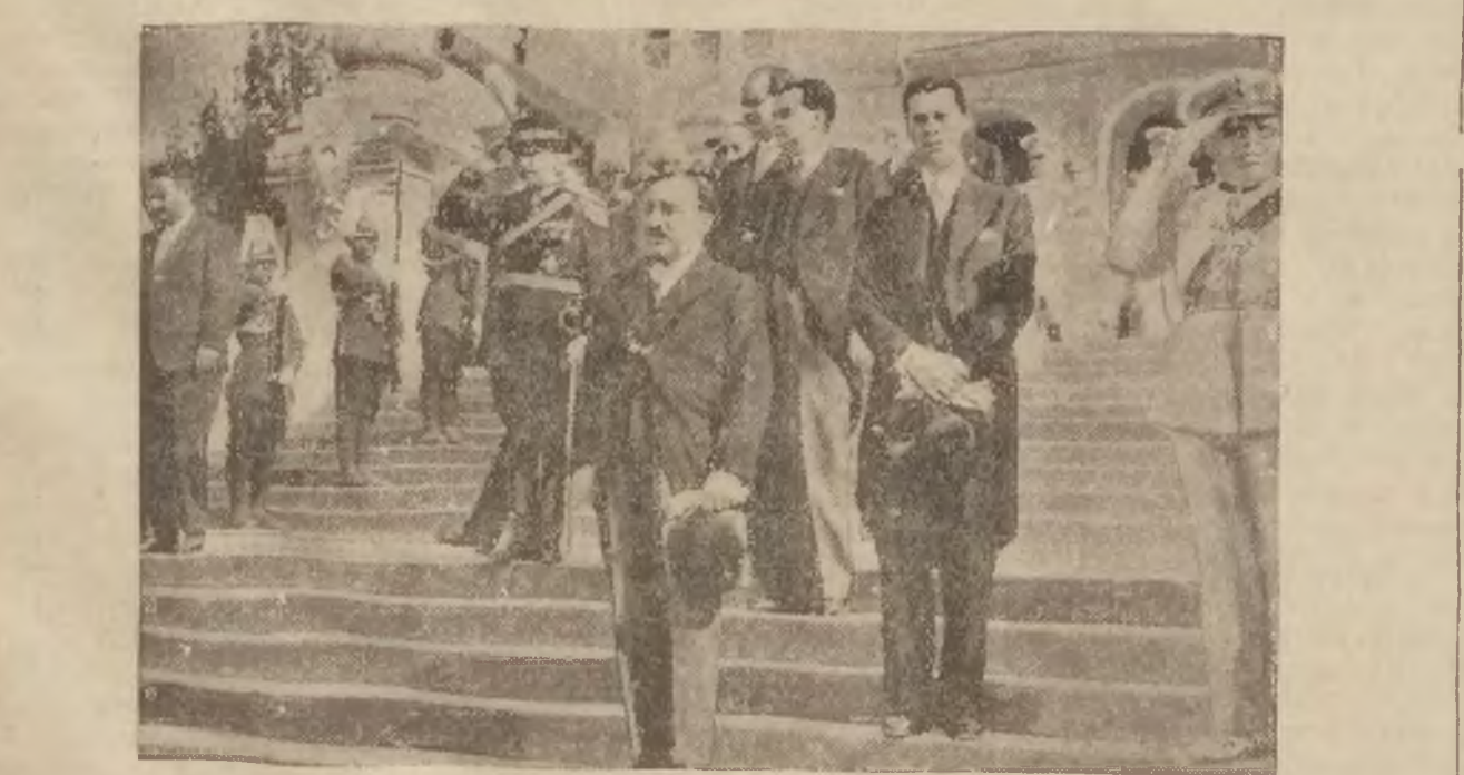
Uczestnicy konferencji: między nimi jugosłowiański minister spraw zewnętrznych Jettiez (na przedzie). W Bukareszcie odbyła się konferencja Malej Ententy. Porządek dzienny obrad stanowiły sprawy związane z rozbrojeniem, oraz zagadnienia środkowo-europejskie i kwestje związane ze stosunkiem do Sowietów.