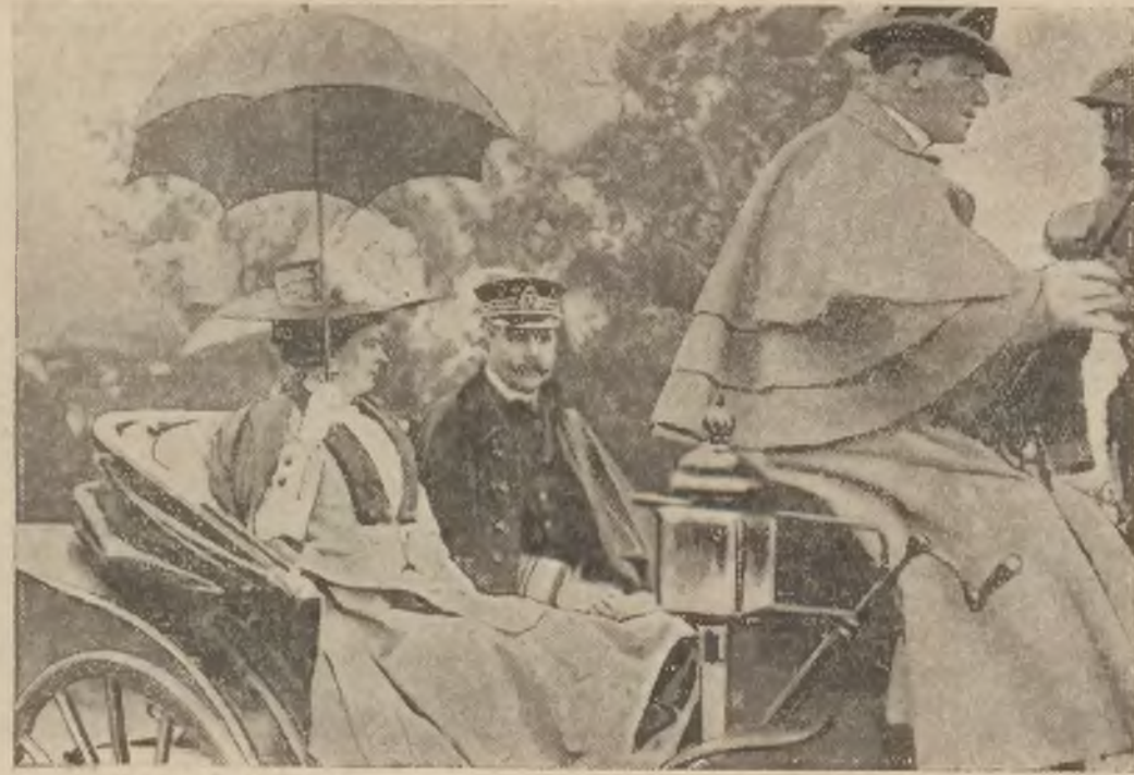
Arcyksiążę Franciszek Ferdynand austriacki i jego żona podczas jednej z ostatnich przejażdżek. 28 czerwca miały dwadzieścia lat od chwili zamordowania austriackiego następcy tronu i jego żony przez Serba Principa, co — jak wiadomo — było fatalnym sygnałem do rozpoczęcia wojny światowej.