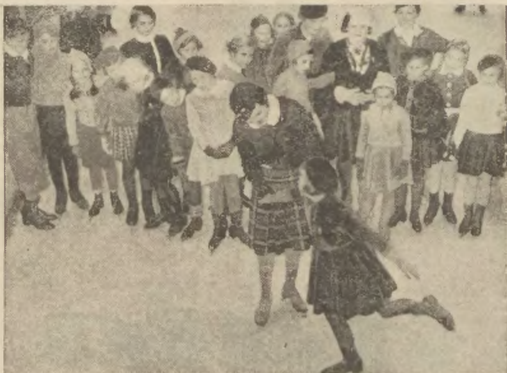
Mistrzynie jazdy sztucznej na lodzie, jak tego dowodzi przykład z przed lat, z Sonją Hennie i innymi...