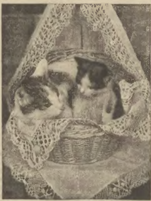
Kocia mamusia z córką.