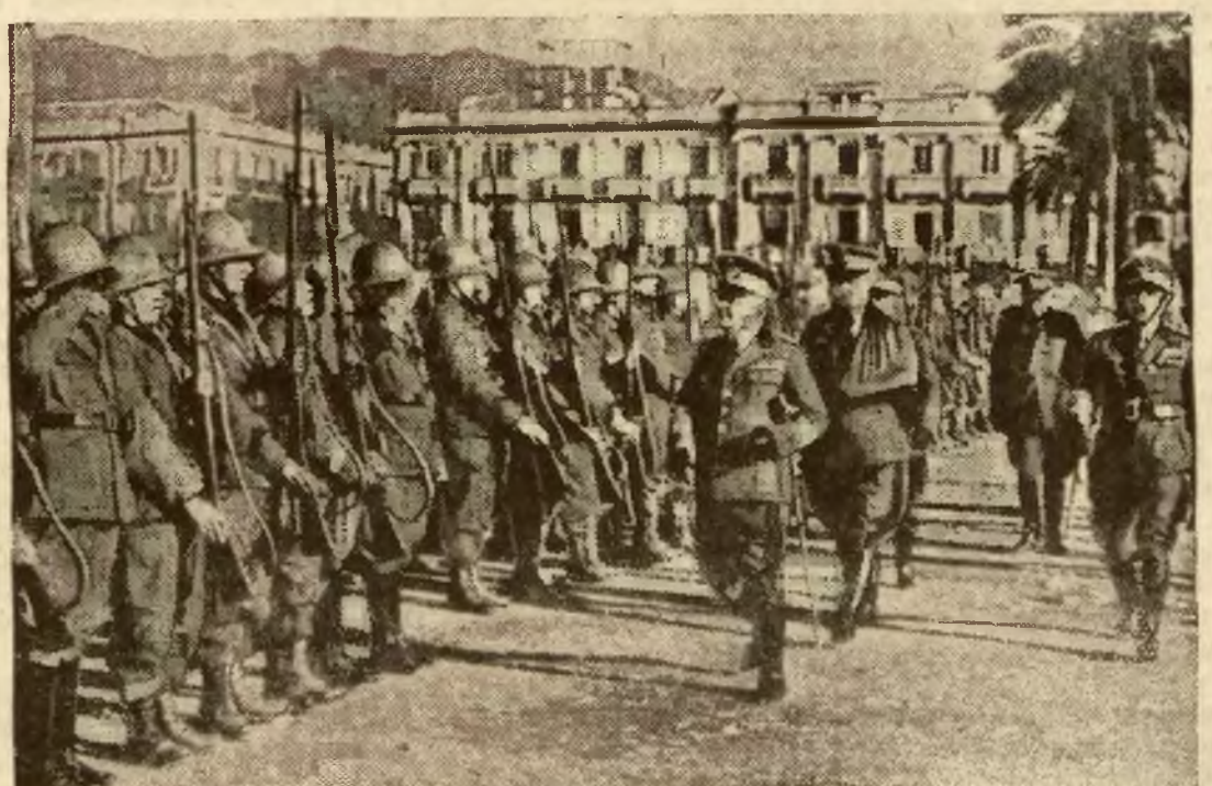
Znowu odszedł z Messyny większy transport wojsk włoskich do Afryki. Przed zaokrętowaniem oddziałów odbył przyjazd ich generał Baistrocci, sekretarz stanu w min. wojny.