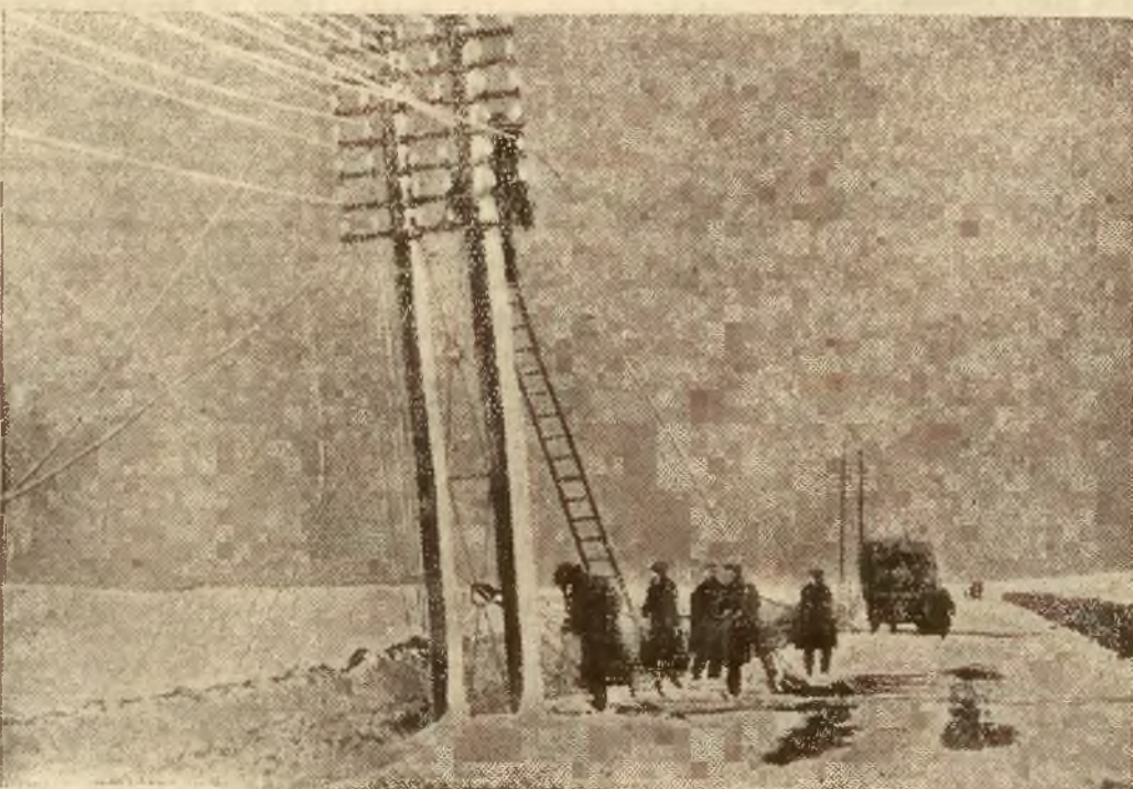
Angielskie hrabstwo Northumberland nawiedziła ostatnio gwałtowna śnieżycy, wyrządzając znaczne szkody w instalacjach telefonicznych i telegraficznych.