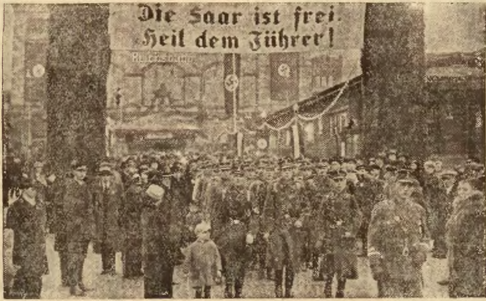
W Zagłębiu Saary święcono uroczystości w dniu wcielenia Zagłębia do Niemiec. Na zdjęciu dworzec w Saarbrücken, w dniu 1 marca.