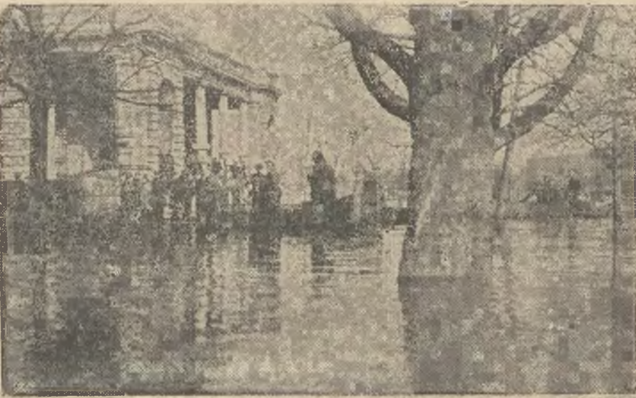
Pałac po-Tyszkiewiczowski zalany. Komunikacja w Cieleśniku łodzią (sytuacja wczoraj po południu)

W ciągu całego dnia wczorajszego Wilja gwałtownie i nieustannie przybierała. Jeszcze nocy wczorajszej zalana ulicę Zygmuntofską o tyle, że ruch pieszy został zupełnie uniemożliwiony. W ciągu dnia przybierająca woda przerwała wszelką komunikację na tej ulicy, zalewając Zygmuntofską do Bogusławskiej, Arsenalską niemal do Mostowej. Jednocześnie zalana została część Cieleśnika. — Woda zbliżyła się o 70 kroków od Katedry. Ul. Kościuski zalana została do mostu na Wilence i od mostu do więzienia wojskowego.