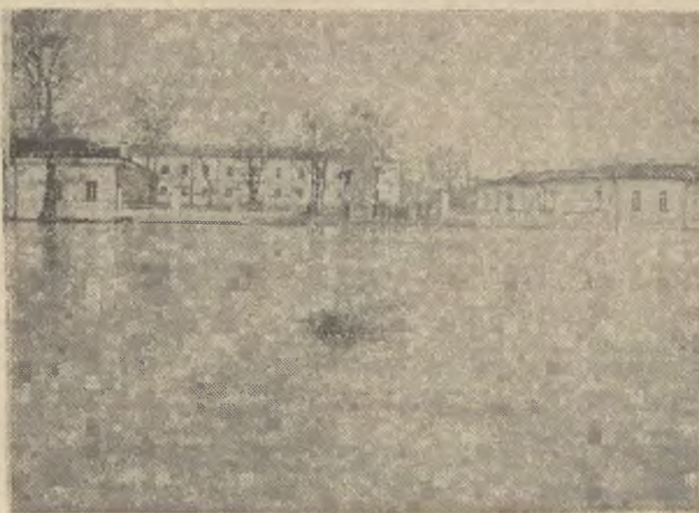
Płaszczyna wodna Wilji z widokiem na pomnik Mickiewicza (sytuacja wczoraj przed południem — obecnie koszary są zalane.)

W przeciągu całego dnia Wilja sżyłkością 3 — do 4 centymetrów na przybierała nieustannie. Około godziny 3 po poł. przybór został zlekka zahamowany, następnie wzmożł się po godzinie 5. Przybór Wilenki ustął już około godziny 2-giej pop. następnego dnia Wilja przybierała w dalszym ciągu z