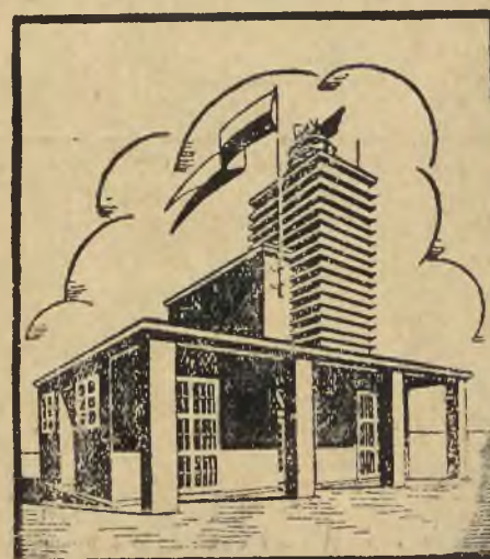
Jeden z pawilonów na P. W. K.

Potomność sprawiedliwej od nas oceni, czy pokolenie nasze wobec narodu i ludzkości spełniło swój obowiązek. Może sądzić wypadnie surowo, może i pochlebnie.