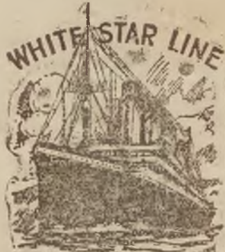
R.M.S. OLYMPIC 46430 tons NAJWIĘKSZY OKRĘT ANGIELSKI