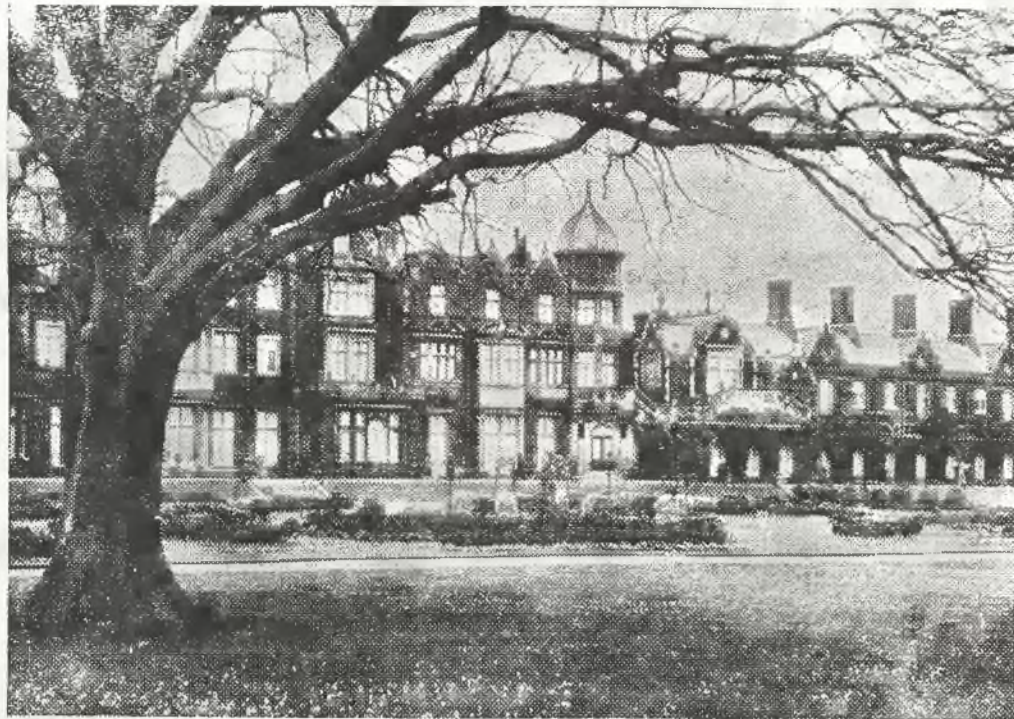
Zamek w Sandringham