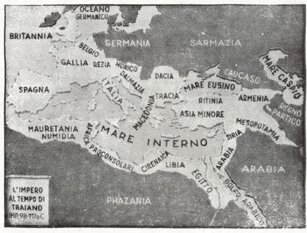
Wobec proklamowania nowego rzymskiego imperjum przez Mussoliniego, interesujące jest porównanie starego rzymskiego państwa, w czasie jego największej potęgi a mianowicie za Trajana w latach 98 do 117 po n. Chr., z dzisiejszym stanem rzeczy.