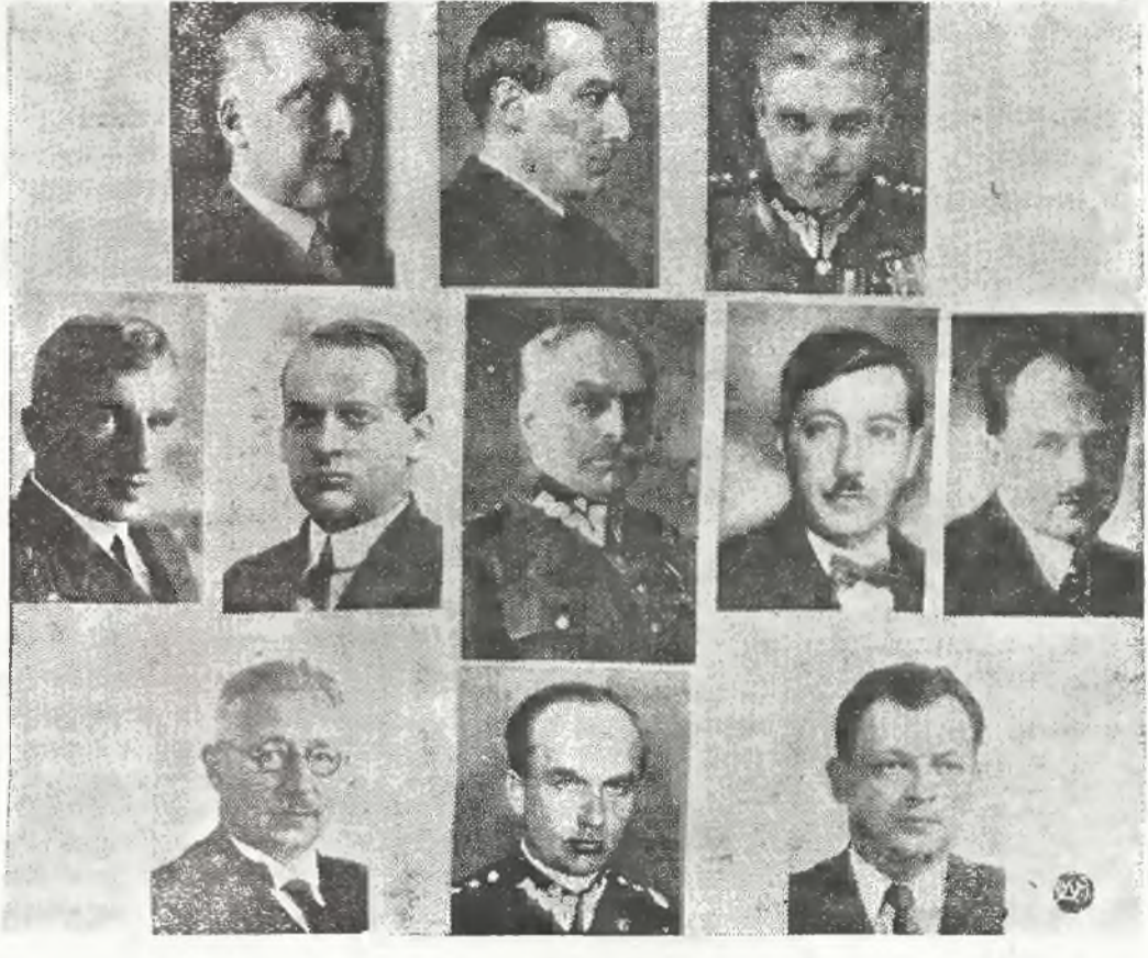
Od lewej, rząd górny min. pocz. i telegrafu płk. Emil Kaliński, min. spr. zagr. J. Beck, min. komunikacji płk. Urych; rząd środkowy: min. roln. J. Poniatowski, min. przem. i handlu A. Roman, premier i min. spr. wewn. gen. Składkowski, min. skarbu Kwiatkowski, min. opieki społecznej Kościłkowski; rząd dolny, min. oświaty W. Świętoślowski, min. spr. wojsk. gen. Kasprzycki, min. sprawje dliwości Grabowski.