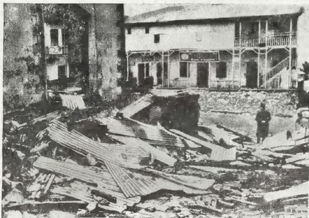
Włosi, którzy wkroczyli do miasta, zastali tam ruiny.