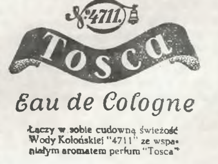
Łaczy w sobie cudowną świeżość Wody Kolodkiej '4711' ze wspaniałym aromatem perfum Tosca