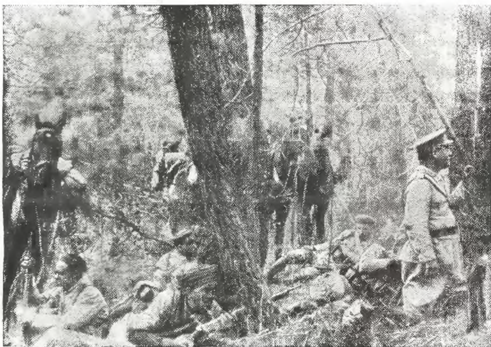
Patrol wojsk marokańskich biwakujący w jednym z parków miejskich Madrytu.