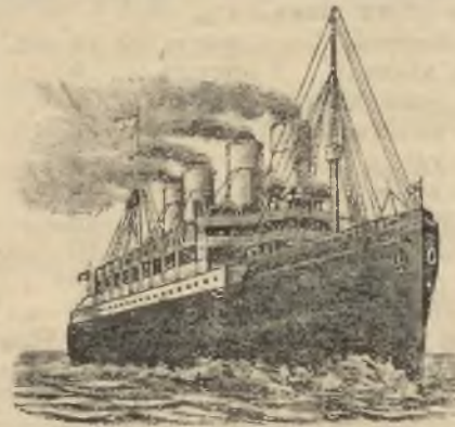
Ц. к. концессионоване

Бюро подорожній і спедиційне Софії Бєсядецької ОСЬВЕНЦІМ, дворець залізниці