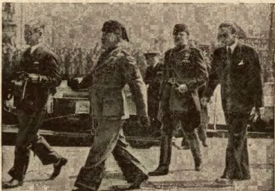
Mussolini, kancelerz Schuschnigg i austriacki sekretarz stanu dr. Guido Schmidt (po cywilnemu), po przybyciu kancelarza Austrii do Wenecji.