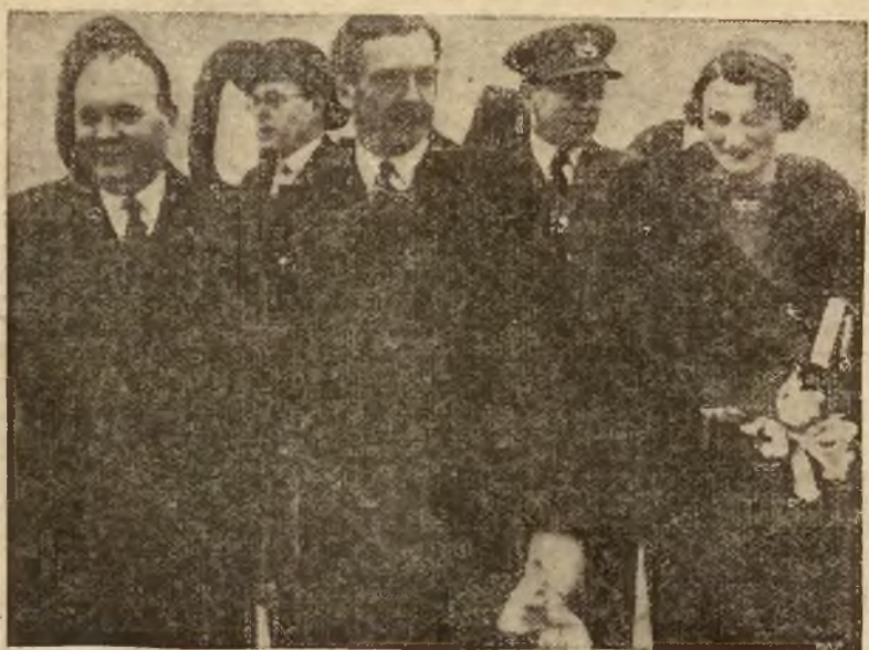
Na zdjęciu naszym min. Eden z żoną, stojący w grupie z ministrem spraw zagranicznych Belgii, w Brukseli.