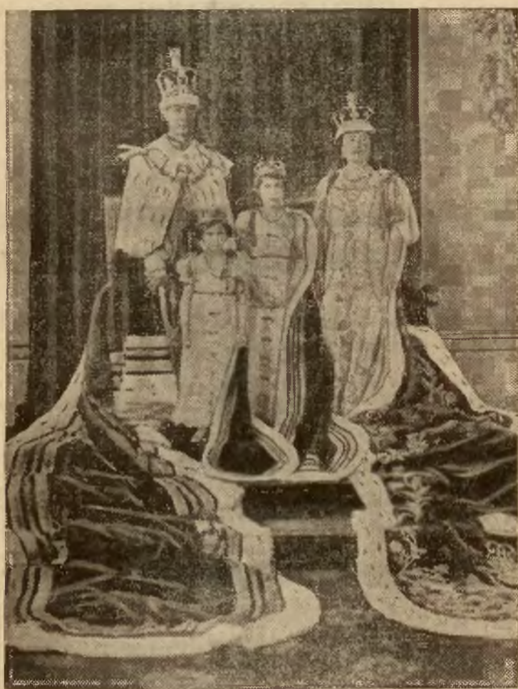
Po koronacji. Król Jerzy VI i królowa Elżbieta z obojwoma księżniczkami.