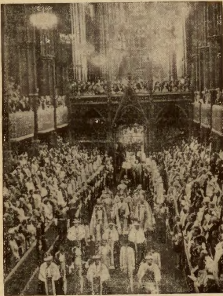
Król Jerzy VI kroczy po koronacji, wśród arcybiskupów.