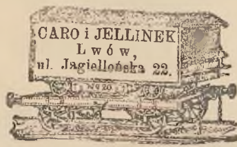
CARO I JELLINEK L w ó w ul. Jagiellońska 22.

Przeprowadzenia w patentowanych wozach, uchylających potrzebę opakowania koleją, okrętem, drogą kołową także w miejscu