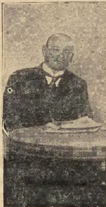
S. P. DR. GUSTAW STRESEMANN

W lecie 1928 r. ulega Stresemann ciężkiej chorobie nerek. Wyszedłszy obroną ręką z groźnego stadium choroby, oddaje się Stresemann ponownie swym obowiązkom. Podminowany jednak organizm nie wytrzymuje już długo ciężaru pracy i nagły atak sercowy kładzie kres działalności najzdolniejszego bezsprzecznie męża stanu, jakiego posiadała Rzesza Niemiecka po wojnie.