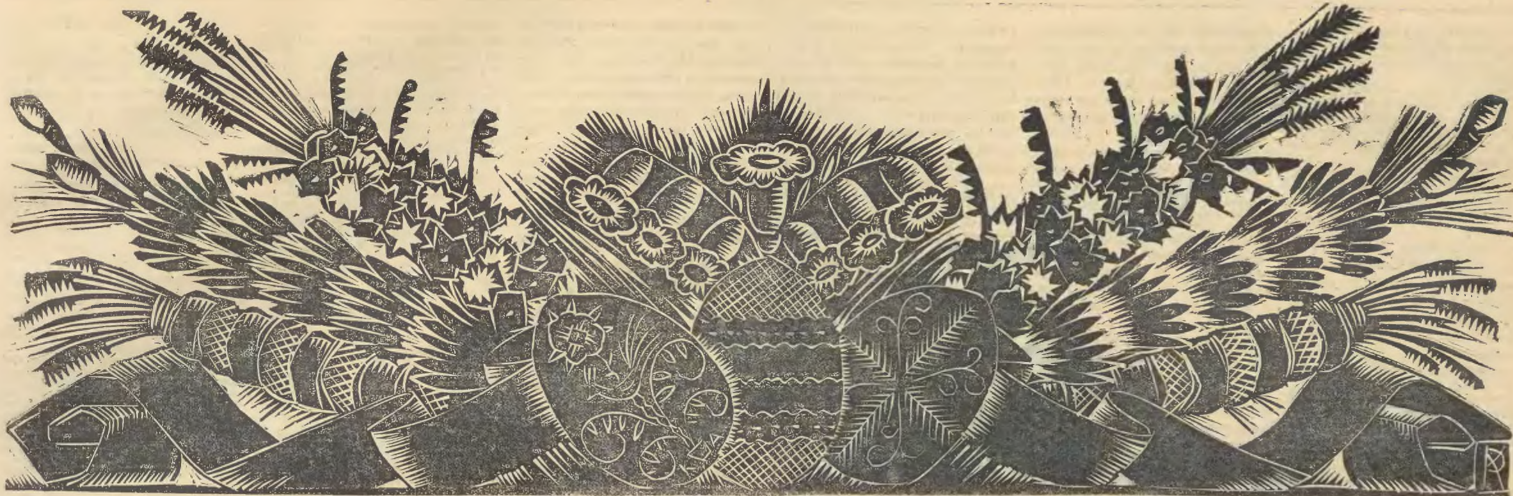
Linoleoryt Kazimierzy Adamskiej - Roubin.