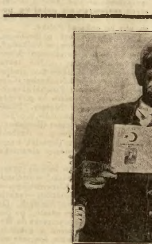
Najstarszy człowiek na świecie. Turek Zaro Agha, ze swoją metryką urodzenia w r. 1774...