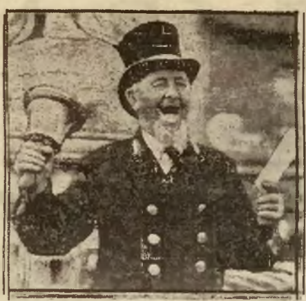
Między innymi przeżytkami i obyczajami konserwatywnej Anglii, zachował się jeszcze urząd wywoławczy, którego urzędnicy wędrują po zapadłych wioskach i miasteczkach, obwieściąc ludności ostatnie postanowienia władz angielskich.

Premjer łotewski o polityce zagran. Łotwy. Premjer łotewski o polityce zagran. Łotwy.