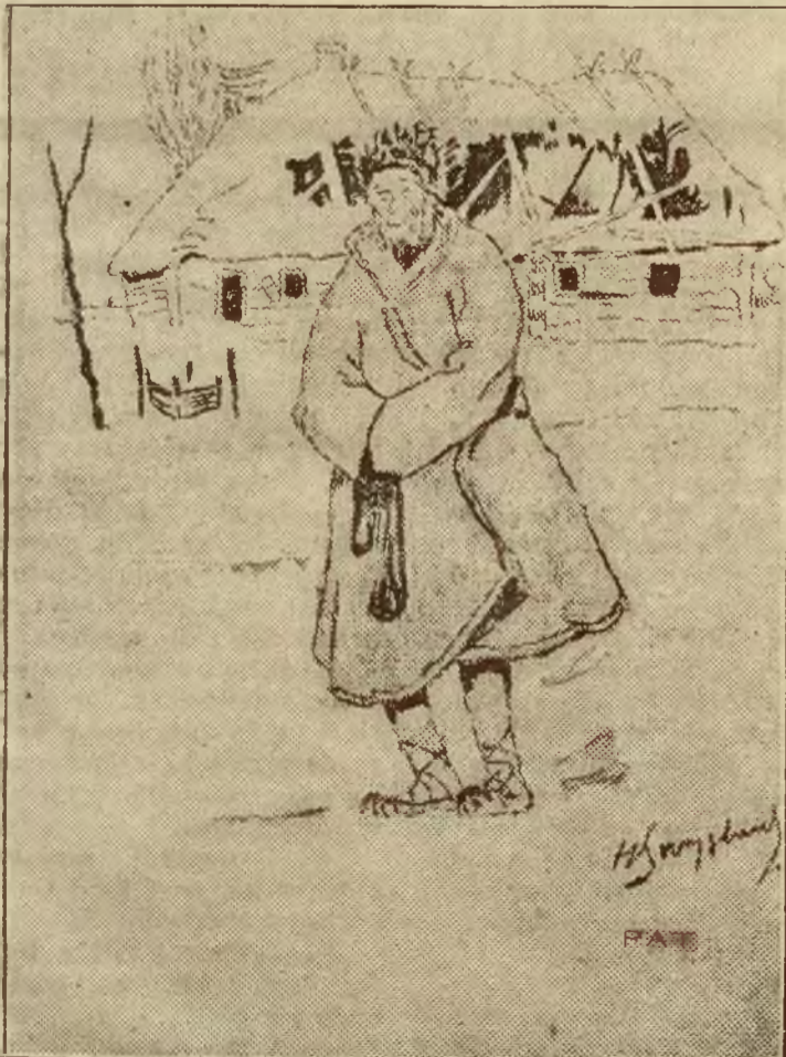
(Z teki art. mal. H. Szczyglińskiego).