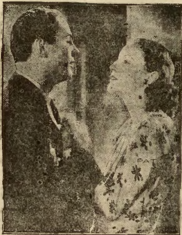
w filmie „Śpiewające miasto“.