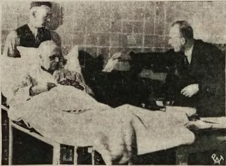
Celem umożliwienia głosowania w Zagłębiu Saary obłożnie chorym, urny wyborcze przenieszone są do szpitali. Na zdjęciu — chora składa swój głos.