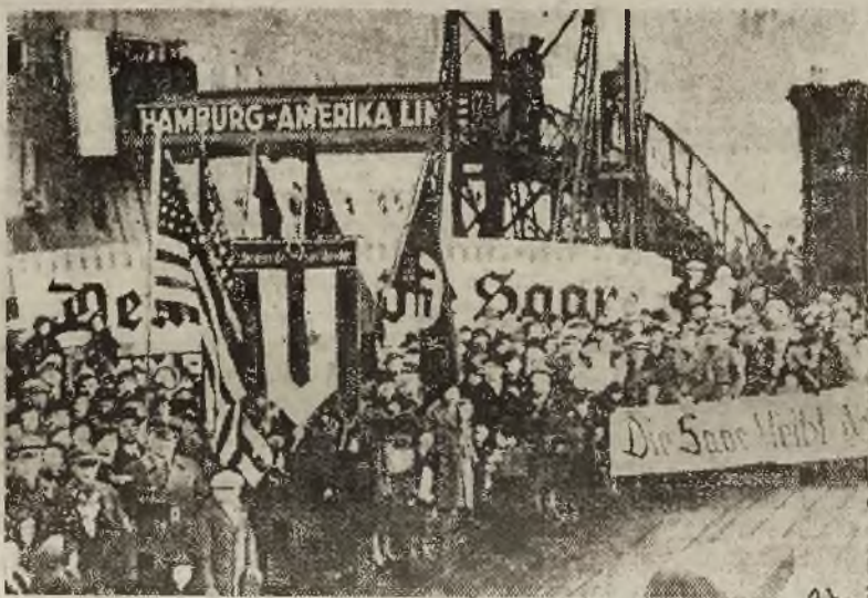
Do Hamburga przybyła w tych dniach z Ameryki większa ilość b. mieszkańców Zagłębia Saary, celem wzięcia udziału w głosowaniu. — Na zdjęciu — grupa b. mieszkańców Zagłębia Saary po wylądowaniu w porcie Hamburgskim, udająca się do Saary.

(Jak wiadomo, wyniki głosowania nie zostaną opublikowane w poniedziałek, a dopiero we wtorek rano. Decyzja ta po dyktowana jest, jak przypuszczają, względami na bezpieczeństwo, by nie do puścić do rozruchów, gdy w godzinach wieczornych, wolnych od pracy, ulice są zapelnione).