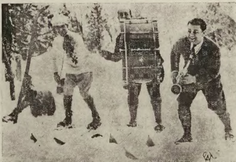
W jednej z modnych miejscowości górskich w Szwajcarii zespół jazzbandowy gra jeżdżąc na nartach.