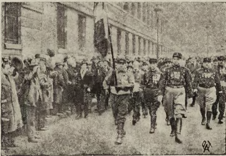
Powracającego z Rzymu po podpisaniu układu francusko — włoskiego min. Spraw Zagran. Laval'a powitał manifestacyjnie na dworcu m. in. Legjon Girelbalczyków.