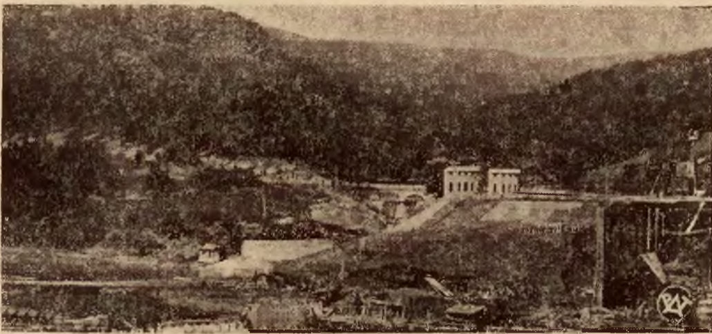
Budowa zapory wodnej na Sole postępuje szybko naprzód. Na zdjęciu górnym — środkowa część zdjęcia przedstawia obecne międzybrodzie, na którego miejscu powstanie olbrzymie jezioro. Woda sięgać będzie poniżej drogi widocznej na lewej stronie zdjęcia. Na zdjęciu dolnym część budowanej tamy.