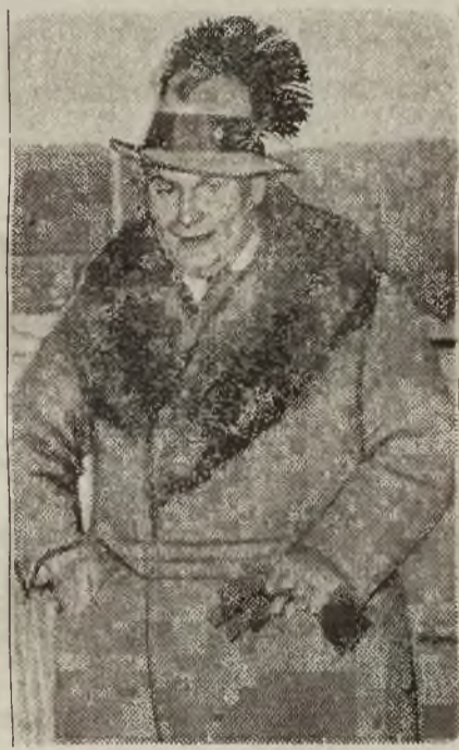
Göring Premier Prus.