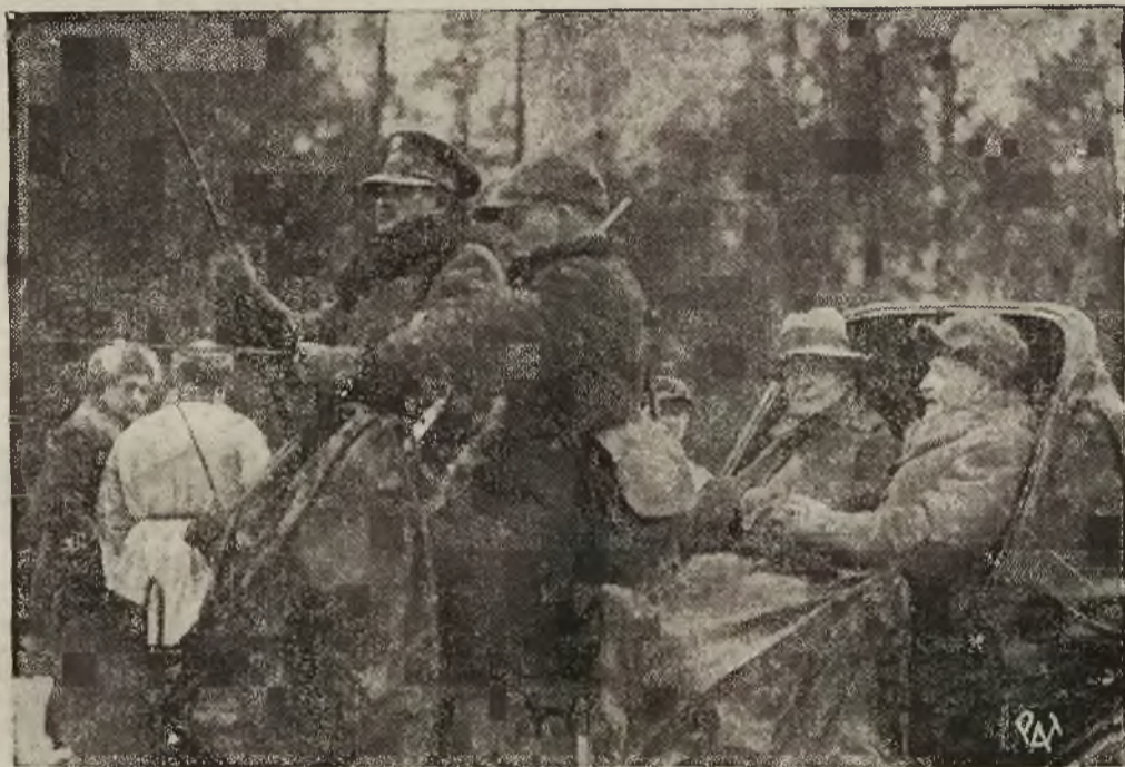
Na zaproszenie P. Prezydenta Rzplitej w reprezentacyjnym polowaniu w Białowieży wziął udział premier pruski p. Herman Göring.