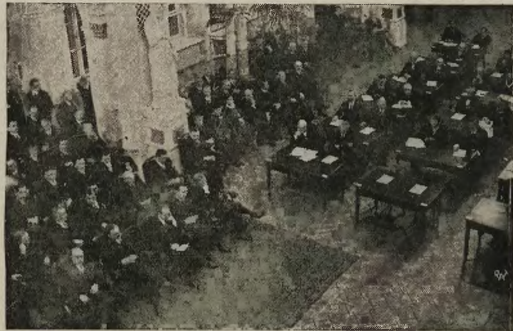
Na zdjęciu — ogólny widok sali Rady Miejskiej podczas posiedzenia, które się odbyło w ub. wtorek.

Rozporządzenie ma wejść w życie z dniem ogłoszenia.