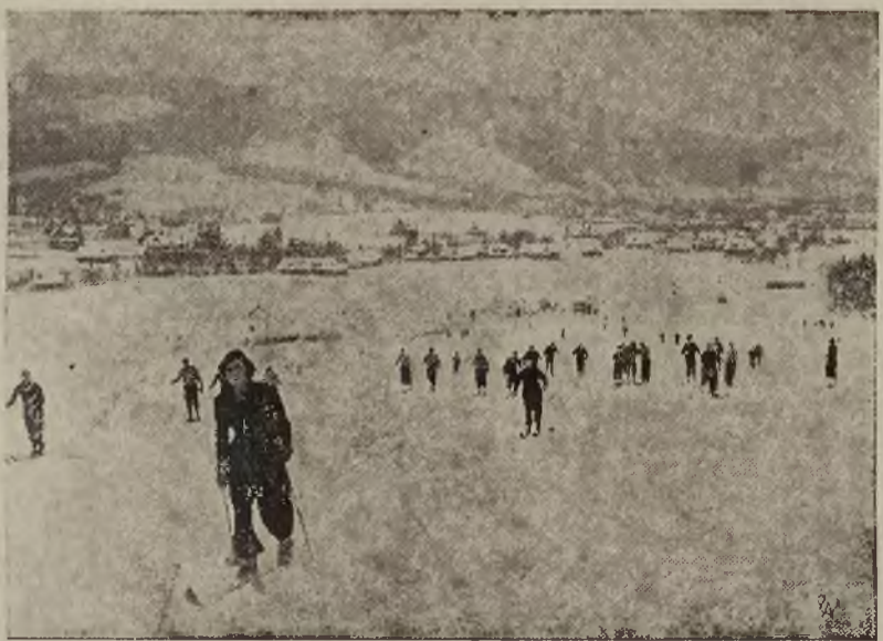
Na nartach pod Regłami.