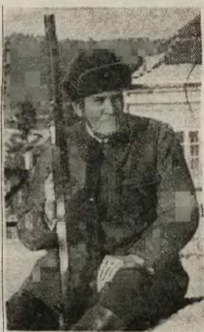
P. Prezydent R. P. przed wyruszeniem na polowanie.