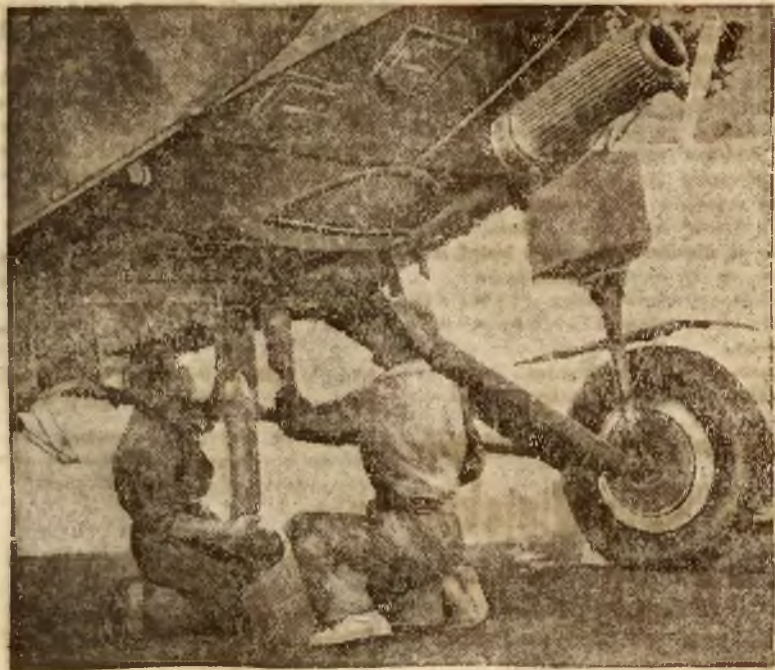
Zawieszanie bomb na samolot włoski przed startem do ataku lotniczego na pozycje abisyńskie.